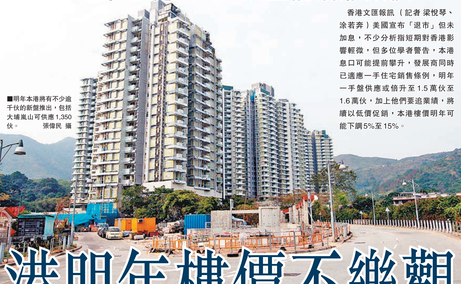
■明年本港將有不少逾千伙的新盤推出，包括大埔嵐山可供1,350伙。

香港文匯報訊（記者 梁悅琴、涂若奔）美國宣布「退市」但未加息，不少分析指短期對香港影響輕微，但多位學者警告，本港息口可能提前攀升，發展商同時已適應一手住宅銷售條例，明年一手盤供應或倍升至1.5萬伙至1.6萬伙，加上他們要追業績，將續以低價促銷，本港樓價明年可能下調5%至15%。