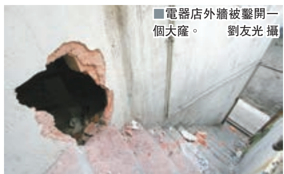
電器店外牆被鑿開一個大窿。

香港文匯報訊(記者劉友光)天寒地凍街上行人稀疏，盜賊半夜趁機四出作案。土瓜灣一間電器店昨凌晨遭賊人鑿開磚牆入內爆竊，將夾萬及收銀機撬開，損失現金逾8萬元。