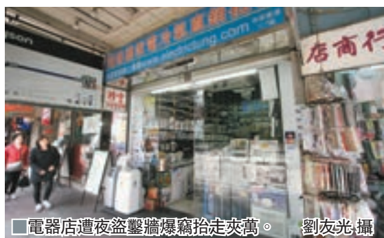
電器店遭夜盜鑿牆爆竊拾走夾萬。

遭爆竊電器店位於馬頭圍道117號地下，屬一間家電冷氣直銷批發店舖。昨晨9時46分，一名21歲職