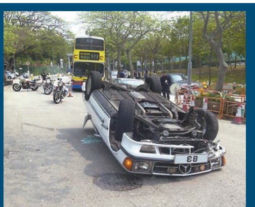
▲名醫李仲賢在2004年在黃竹坑道駕車失事「反肚」的古董平治跑車。資料圖片 ◀李仲賢。資料圖片