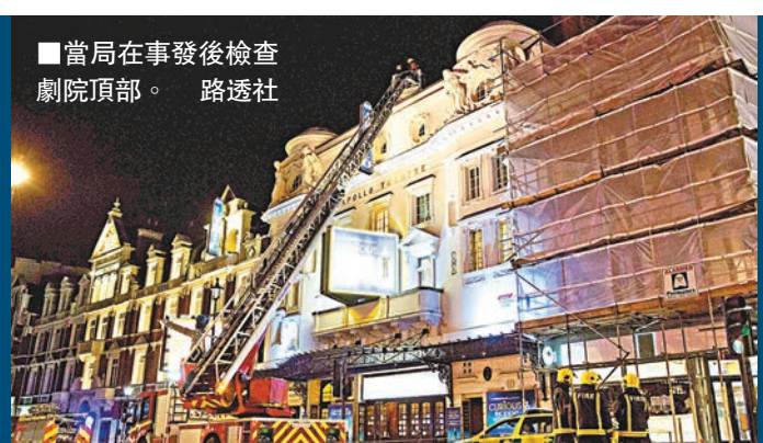
■當局在事發後檢查劇院頂部。