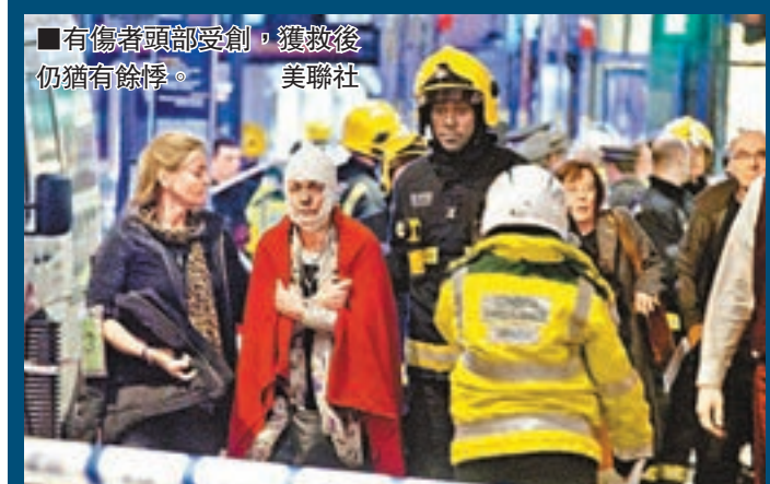
■有傷者頭部受創，獲救後仍瀕有餘生。