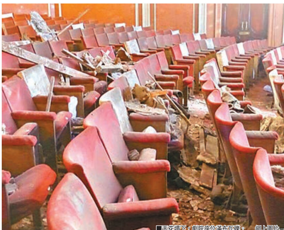
▲天花塌下，劇院座位滿布瓦礫。