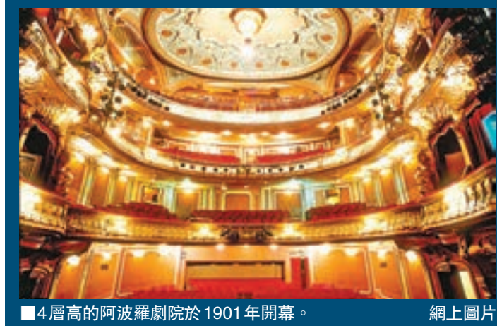
■4層高的阿波羅劇院於1901年開幕。網上圖片