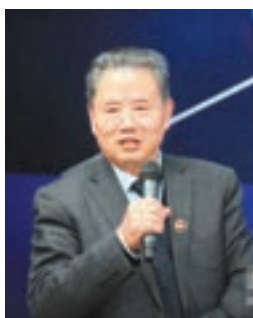
■彭光謙少將。網上圖片

香港文匯報訊(記者 軼璋 北京報道)據新華網報道,中國國家安全論壇副秘書長彭光謙少將日前公開表示,今天的日本與第二次世界大戰前夕的日本驚人地相似,特別是在軍國化道路上,「暴走」的日本正再次成為亞太地區戰爭危機策源地。