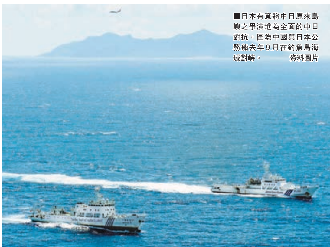
■日本有意將中日原來島嶼之爭演進為全面的中日對抗。圖為中國與日本公務船去年9月在釣魚島海域對峙。

法新社報道說,日本外務省最近幾個月曾頻頻召見程永華,但岸田文雄不願披露兩人會談的詳細內容,僅表示,雙方在「互惠關係」的基礎上,進行了「有意義的意見交流」。