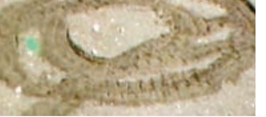
■「玉兔」號月球車轉彎調頭在月球表面留下的痕跡。

據新華社報道,「玉兔」號月球車14日隨嫦娥三號成功降落月球,15日「走」出嫦娥「懷抱」開始月面巡視探測。月球上一晝一夜約28個地球日,月晝和月夜各長約14個地球日。16日開始,月球車迎來月晝高溫考驗,轉入「午休」模式——移動等分系統停止工作。根據測試結果,月球車上太陽光直射部分高達100攝氏度,而背光的陰影部分低至零下。