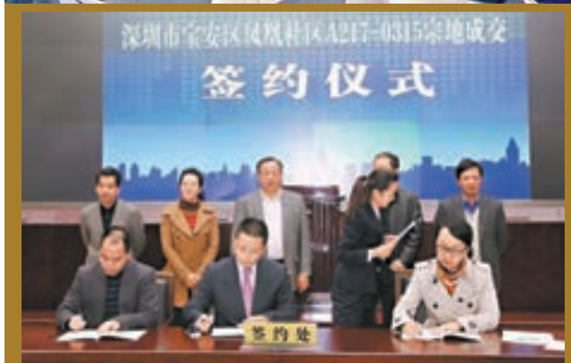
寶安鳳凰社區首宗農地成交簽約儀式。