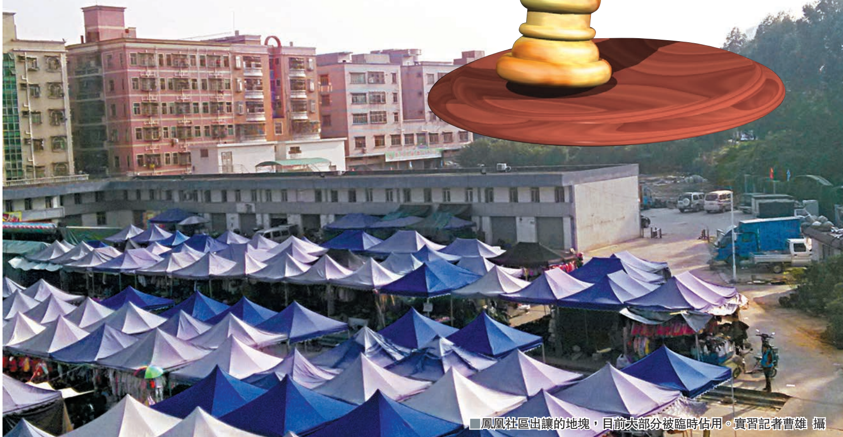
鳳凰社區出讓的地塊，目前大部分被臨時佔用。