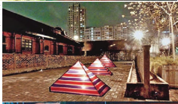
陳廣華作品《麥當奴+KFC》