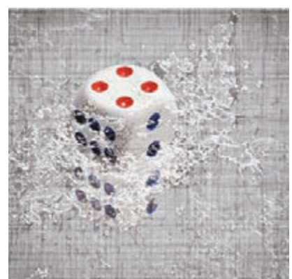
傅文俊作品《遊戲》系列之四。

骰子的形象，最早出現在傅文俊油畫作品《信手拈來第十八號》，「我今年一直在構思世界博弈主題，究竟該如何表現，起初也想了很多。」傅文俊從構思到第一幅成品，用了近一年時間。作品中又輔以水流，在規則之餘，又道破國際布局規則發展變化的