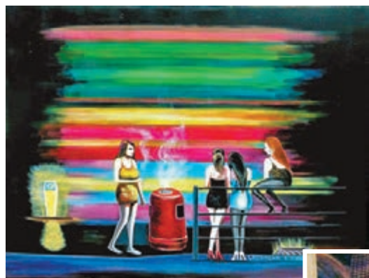
陳廣華作品《打邊爐》