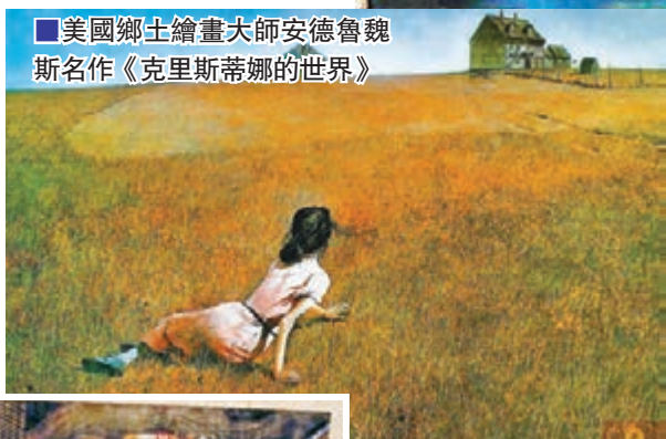
美國鄉土繪畫大師安德魯魏斯名作《克里斯蒂娜的世界》