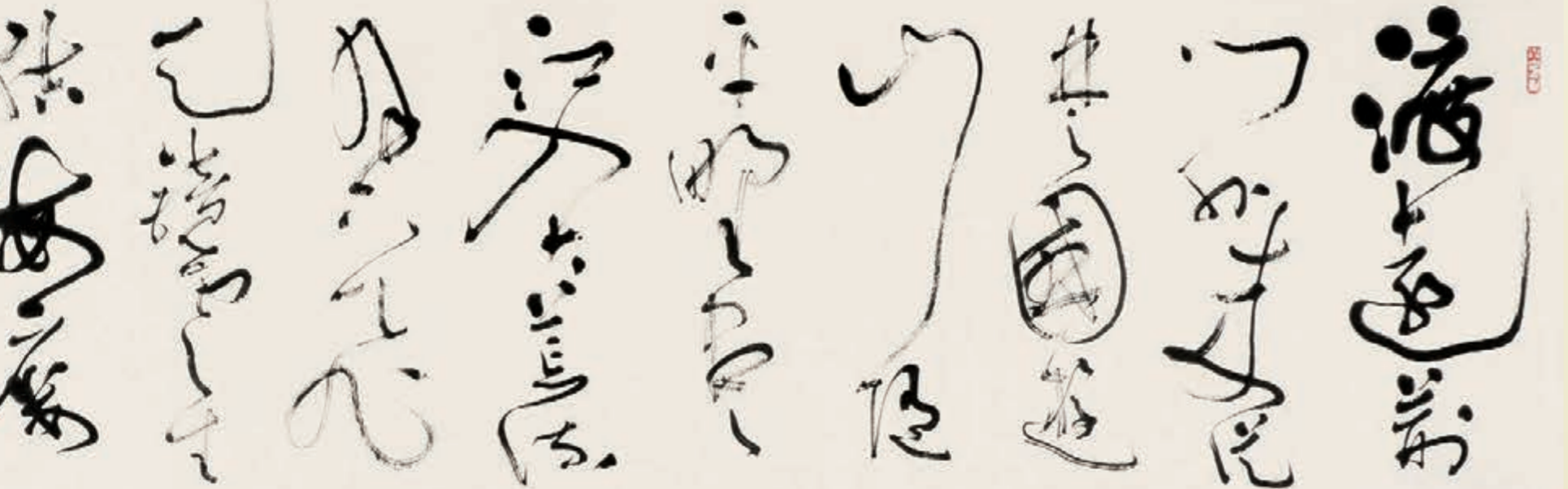
■大草李白詩《渡荊門送別》 渡滄門外來，來從楚國遊。山隨平野盡，江入大荒流。月下飛天鏡，雲生結海樓。仍憐故鄉水，萬里送行舟