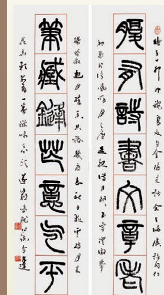
■小篆對聯 腹有詩書文章老 筆鐵鑄芒藝氣平