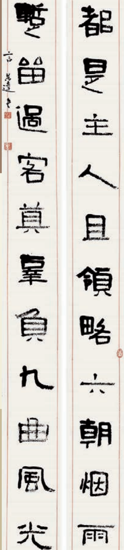
■隸書對聯 都是主人且領略六朝烟雨 暫留過客真羣負九曲風光

受業於著名書畫家沙曼翁、宋文治先生，精多種書體，工篆刻、善繪畫。作品參加過全國第二至第十屆書法篆刻展、數屆全國中青年書法作品展、國際書法展和當代名家書畫篆刻作品展，先後在500多次國家級、國際性和各類全國性展覽中入選並數次榮獲大獎。作品還多次赴日本、韓國、新加坡、巴西、加拿大、美國、法國、菲律賓和中國台灣、香港、澳門等國家與地區交流，並於2010年11月在聯合國總部「首屆中文日」舉辦特展。2008年北京第29屆奧林匹克運動會時創作的《我的中國心》長卷、2010年上海第41屆世界博覽會時創作的《城市讓生活更美好》長卷、2011年在美國夏威夷大學APEC文化論壇展出的《世紀青襟——言恭達書畫推動百年中國歷史進程人物詩抄》和2012年倫敦奧林匹克美術大會《體育頌》書法長卷贏得海內外一致讚譽。作品收入《中國現代美術全集》（書法卷和篆刻卷）、《中國當代書法大家》等500多種全國性專集。1987年全國「當代中青年《書苑精英》評比」中，作品以最高評票被評為全國37位優秀作者之一。作品還被選刻於全國各地100多處碑林，並被中國國家博物館、中國美術館等國內外100多家博物館、美術館、紀念館和中南海，人民大會堂佈置與收藏。書學論文多篇參選「全國書學研討會」，選入《當代中國書法論文選》，獲「中國文聯文藝評論一等獎」等。出版《抱雲堂》等書畫專集與《抱雲堂詩評》等專著，《當代書法名家》（字帖）及教材，參與合編《六體書字典》、《中國書法名作鑒賞辭典》等。