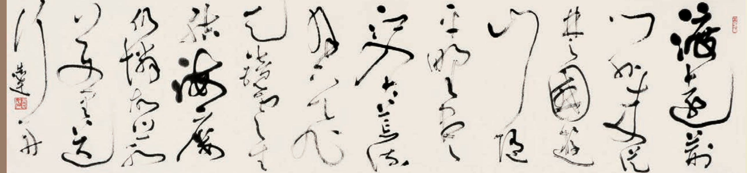
■大草李白詩《渡荊門送別》 渡滄門外來，來從楚國遊。山隨平野盡，江入大荒流。月下飛天鏡，雲生結海樓。仍憐故鄉水，萬里送行舟