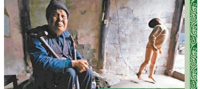
網友發帖傳送鎖鎖男童行乞的照片，令人心酸。 網上圖片

浙江 網友近期發帖稱，他在浙江嵊州市客運西站附近「看到心酸的一幕」：一名成年男子用鐵鏈牽着一名男孩，在一輛出租車旁邊行乞。該男孩穿着長袖外套和牛仔褲，但雙腳光着，沒有穿鞋襪。事件引起關注。 記者到嵊州市谷來鎮，找到鐵鏈男孩的棲身之地，一間陰暗潮濕的土磚房間，瀰漫着刺鼻的霉味，鐵鏈男孩右腳上纏着近2米長的鐵鏈，鐵鏈的另一端拴在離地2米牆壁鐵釘上，他光着下身，赤着腳，在地上跳來蹦去，嘩嘩鐵鏈聲直扣心竅，讓隨行的兩位警察唏噓不已，眼角發濕。