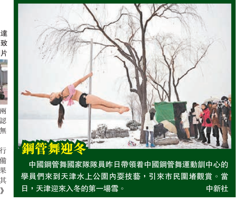
鋼管舞迎冬 中國鋼管舞國家隊昨日帶領着中國鋼管舞運動訓練中心的學員們來到天津水上公園內耍技藝，引來市民圍堵觀賞。當日，天津迎來入冬的第一場雪。 中新社