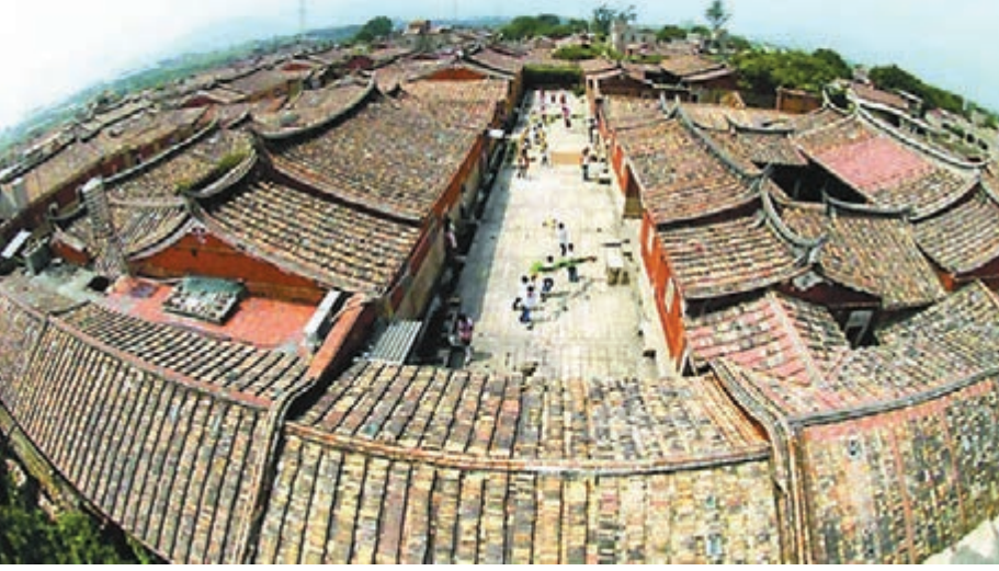
位於福建泉州市的紅磚厝建築。 網上圖片

香港文匯報訊 綜合報道，台「文化部長」龍應台上周提出兩岸合作為台景點申請世界遺產的構想，引起兩岸熱議，國台辦對此亦給予正面回應。據福建廈門媒體昨日報道，當地文化部門證實已獲獲台灣金門縣文化部門邀請，表示願意就兩地共有的閩南紅磚厝(福建沿海及台灣人稱家或屋子為厝)聯袂申遺，為兩岸合作申遺創先例。