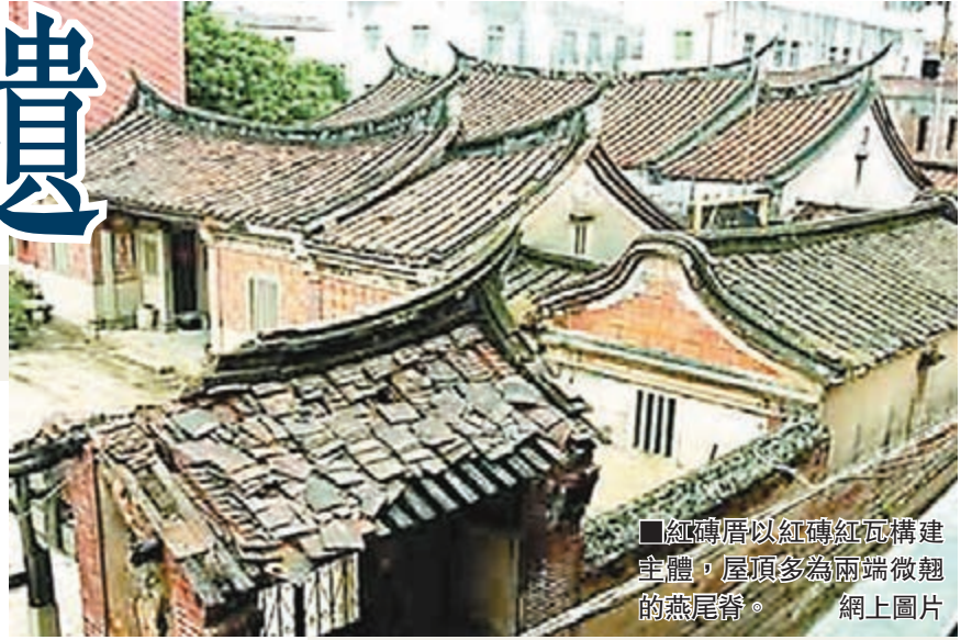
紅磚厝以紅磚紅瓦構建主體，屋頂多為兩端微翹的燕尾脊。 網上圖片

輿論指出，現實障礙還有不少，申遺該以何種名義，如何共享資源，這些細節問題，都有待兩岸坐下來商談。