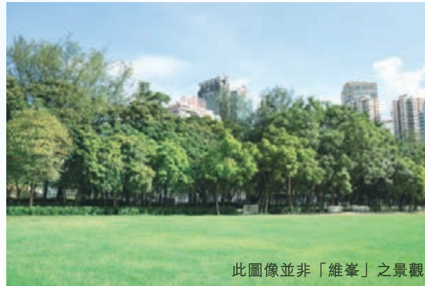
此圖像並非「維峯」之景觀

維峯坐擁雙站優勢，步行至港鐵天后站或炮台山站只需數分鐘*，迅速連接中環、尖沙咀、港島東；加上中環及灣仔繞道和東區走廊連接路預計於2017年啟用**，交通網絡將更完善。此外，步行約1分鐘*便到達佔地約19公頃、港島區最大的公園#—維多利亞公園；鄰近銅鑼灣繁華盛景，多間星級酒店、逾百頂尖名店雲集。矚目地標如中央圖書館、香港遊艇會及南華體育會運動場等，咫尺可達。