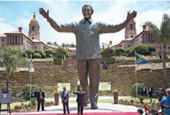
■比勒陀利亞的曼德拉銅像揭幕。

南非前總統曼德拉前日在家族墓地落葬，為表達他一生走過崎嶇的「漫漫自由路」，建築師斯特勞特特意在花園建造一段彎曲小路，讓拜祭人士體會曼德拉的傳奇人生。 斯特勞安排曼德拉於山頂安葬，可俯瞰成長地庫努村。道路以山腳為起點，至曼德拉墓地全長1.2公里，創作靈感來自曼德拉回憶錄《漫漫自由路》。 遊人先走過平坦路面，代表曼德拉抬頭抗爭前一切平靜，之後便會轉彎，象徵他入獄。小路隨後開始彎彎曲曲，儼如他奮鬥掙扎的過程，最後到達山頂，即曼德拉獲釋。 斯特勞指，花園前身是一處沒有樹木或植物的牛隻牧場，因此需從曼德拉出生地姆維索收集蘆薈、金合歡屬植物和多種野草，期望把姆維索帶到庫努，另外山腳位置將有博物館竣工。