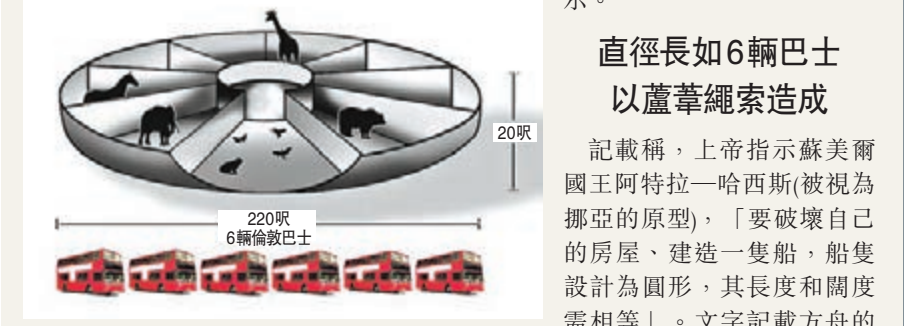
直徑長如6輛巴士以蘆葦繩索造成

提到《聖經》中的挪亞方舟，一般人都會想到是一艘大船，但英國一名學者有驚世發現，稱一塊有3,700年歷史的黏土板，揭示方舟原來是圓形大船，且主要材料不是木，而是蘆葦和繩索。 大英博物館「古代美索不達米亞筆跡、語言及文化部」助理管理員芬克爾稱，他解讀該塊古巴比倫時期的黏土板時，從當中的60行楔形文字發現，裡面詳述了方舟的故事及造船指