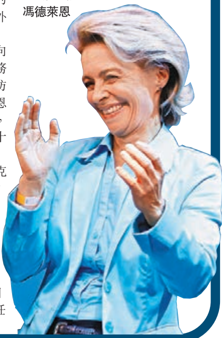
■新任防長馮德萊恩