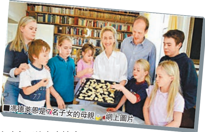
■馮德萊恩是7名子女的母親。

德國總理默克爾今日展開第3度任期，前日公布大聯盟政府內閣名單，當中7子之母的馮德萊恩將出任國防部長，是聯邦德國歷來首名女防長。55歲的馮德萊恩是政壇新星，作風務實深受歡迎，被視為有力競逐下屆總理，繼承默克爾「德國鐵娘子」衣鉢。