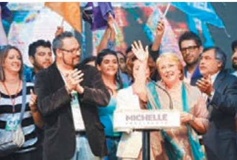
■巴切萊特向支持者揮手。

智利前日舉行總統大選次輪投票，反對派「新多數聯盟」候選人、前總統巴切萊特擊敗執政黨候選人馬泰，繼2006年成為首位女總統後，再度上台。分析指，社會瀰漫不滿情緒，民眾對現政府失去信心，是執政黨失利原因。 首輪投票於上月17日舉行，巴切萊特和馬泰在9名候選人中得票居前兩位，但均未獲得過半數。62歲的巴切萊特在次輪投票獲逾62%選票，輕鬆取勝。她將於明年3月11日宣誓就職，任期4年。她承諾就任後推進教育和稅收等改革，爭取實現免費教育，減少社會不公。 馬泰承認落敗，並前往巴切萊特競選總部道賀。首都聖地亞哥有民眾上街慶祝，有選民希望巴切萊特能修改前獨裁總統皮諾切特遺留的憲法。 中國外交部發言人華春瑩表示，智利是首個與新中國建交的南美國家，期望中智戰略夥伴關係不斷邁上新台階。