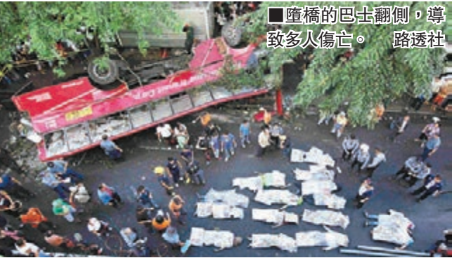
■墮橋的巴士翻側，導致多人傷亡。

菲律賓首都大馬尼拉地區昨發生嚴重車禍，一輛載客巴士從6米高的高架公路墮下，壓毀下方一輛小巴，造成最少17人死16傷。小巴司機奇蹟受輕傷，巴士司機危殆。 事發於清晨約5時，巴士經過Skyway收費公路帕拉尼亞市路段時突然衝出橋面，跌落下方的南呂宋高速公路，壓中駛經的小巴。巴士車身嚴重變形，小巴幾乎被壓扁。 交通管理人員判斷，巴士可能因高速行經濕滑路段，失控撞欄肇禍。目擊者稱，出事時天色昏暗並下雨，估計巴士時速達100至110公里。生還乘客指，司機曾嘗試轉彎阻止巴士失控。當局勒令肇事巴士公司旗下所有78輛巴士停駛30日檢查。 菲律賓不少客運公司為節省經費，無妥善維護巴士，涉及巴士的車禍多是因煞車掣不靈或車胎被磨平而起。