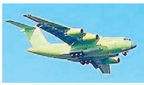
成功首飛的第2架運-20原型機。

從解放軍所面臨的搶險救災、部隊集結和武裝力量投送需求來看，中國對運-20的需求數量將非常龐大。僅以一個空運批次來看，如果需要在主要戰役方向上投放一個坦克裝甲旅，兩個空降戰車團，外加1,500人的傘兵及傘兵配屬的突擊車、指揮車、武裝直升機等，就至少需要250架左右的運-20。運-20及其配套發動機若能順利服