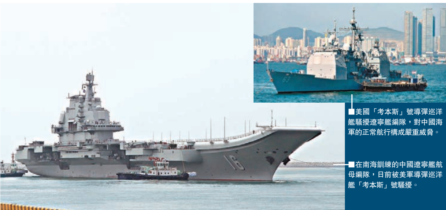
美國「考本斯」號導彈巡洋艦騷擾遼寧艦編隊，對中國海軍的正常航行構成嚴重威脅。

他指一個典型的航母編隊通常採取遠中近三層攻火力配系，其中第一、第二層攻防主要用於對敵攻擊和保護整個航母編隊的安全，第三層則主要是戰鬥群內各作戰單元的自身防衛，即內防區，防禦縱深距母艦僅0.1公里至45公里。中國海軍編隊艦機對「考本斯」號提出安全航行警告，但它卻執意迫近航母編隊內防區，對中國海軍的正常航行構成威脅。