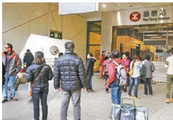
油塘站有不少乘客到埗才發覺封站，望門興嘆。