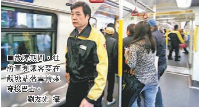
故障期間，往將軍澳乘客要在觀塘站落車轉乘穿梭巴士。

香港文匯報訊（記者 杜法祖）「列車行行下突然傳出『嘍』一聲巨響，好似爆炸，好震撼，隔了10多秒又有第二下，之後再有第三四下，其他乘客不知發生甚麼事都好驚……」乘客李先生憶述事發經過時猶有餘悸。