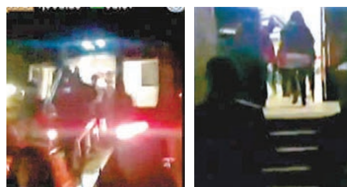
乘客走下漆黑管道（左圖），前往月台（右圖）。