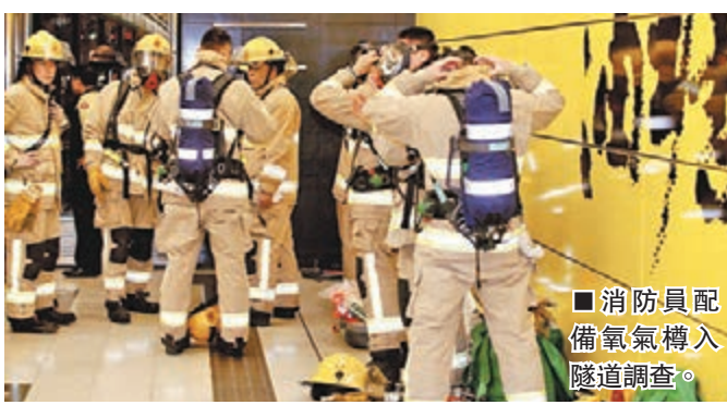
消防員配備氧氣樽入隧道調查。