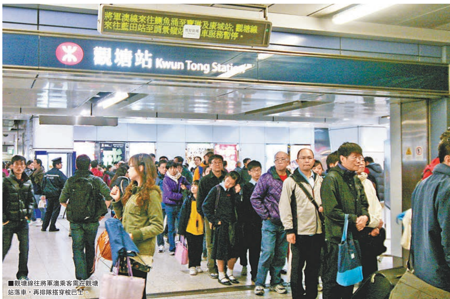
觀塘線往將軍澳乘客需在觀塘站落車，再排隊搭穿梭巴士。

香港文匯報訊（記者 劉友光、杜法祖）港鐵將軍澳線昨發生通車以來最嚴重事故，數十萬乘客大受影響。油塘站至調景嶺站之間一條高壓電纜下墜，導致將軍澳線及觀塘線各有一班列車跳擊停駛，靠近油塘站的列車集電弓更因觸及肇事電纜而受損，被迫停在管道內，150名乘客須沿路軌步行50米到月台。受事故影響，將軍澳線來回全線及觀塘線調景嶺往來觀塘，合共10個車站服務癱瘓近5小時，下班繁忙時段始復正常，事件中幸無人受傷。有乘客投訴港鐵指示不清，安排混亂，在觀塘更出現逾千乘客冒雨排隊等候接駁巴士的狼狽場面。運輸及房屋局局長張炳良已要求港鐵就事故提交報告，稱港鐵有可能面對750萬元罰款。