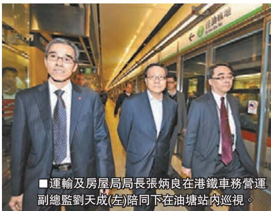
運輸及房屋局局長張炳良在港鐵車務營運副總監劉天成(左)陪同下在油塘站內巡視。

香港文匯報訊（記者 聶曉輝）港鐵將軍澳線架空電纜鬆脫事故發生後，運輸及房屋局局長張炳良傍晚到油塘站視察，了解事件起因。張炳良表示，今次事故起因是由於兩條鐵路線出現電纜跳掣，事件罕有，港鐵工程人員仍需進一步了解肇事原因；港府已按既定程序，要求港鐵在3個工作天內提交報告，就今次事故作詳細交代。他指出，若按照服務表現安排的罰款機制，今次延誤5小時可向港鐵罰款750萬元。