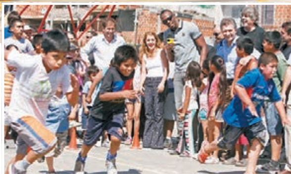
保特(中)探訪貧民區。

同樣是在美洲，同樣是做善事，日前在美國波士頓就舉行了一年一度的「聖誕泳裝跑」慈善活動，為這個寒冷聖誕增添暖意。