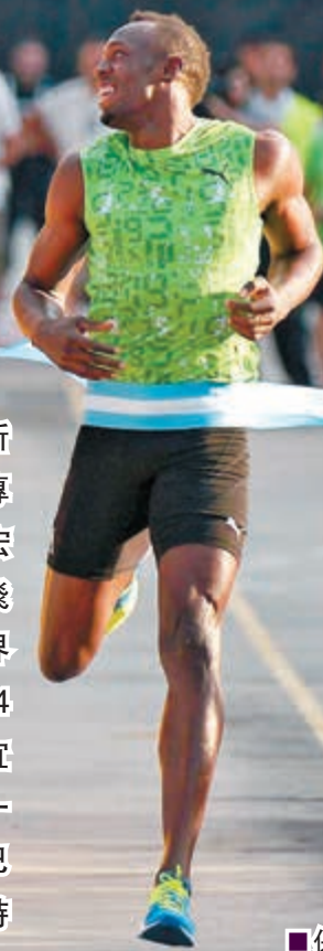
保特(右)望着巴士笑衝線。

新華社布宜諾斯艾利斯14日體育專電(記者 葉書宏 趙燕燕)牙買加「飛人」、男子百米世界紀錄保持者保特14日在阿根廷首都布宜諾斯艾利斯接受了一項特殊的挑戰：與巴士競速。結果，保特輕鬆獲得了勝利。