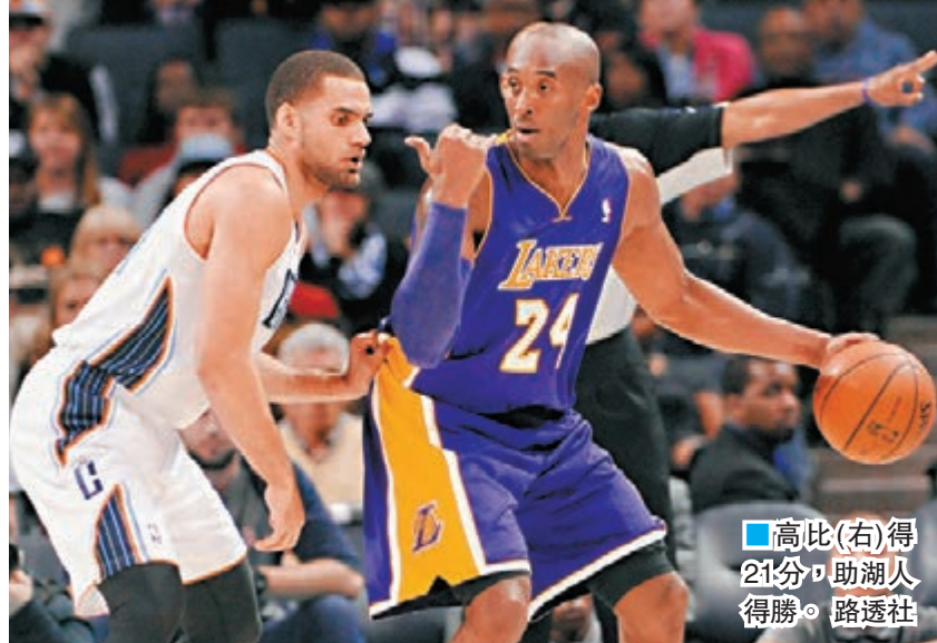
高比(右)得21分，助湖人得勝。

但14日面對山貓，高比在關鍵時刻發力。第三節結束時，湖人以64:68落後，第四節上半段湖人仍不見起色，在比賽還有2分50秒時，山貓仍然以85:79領先。此時高比開始發