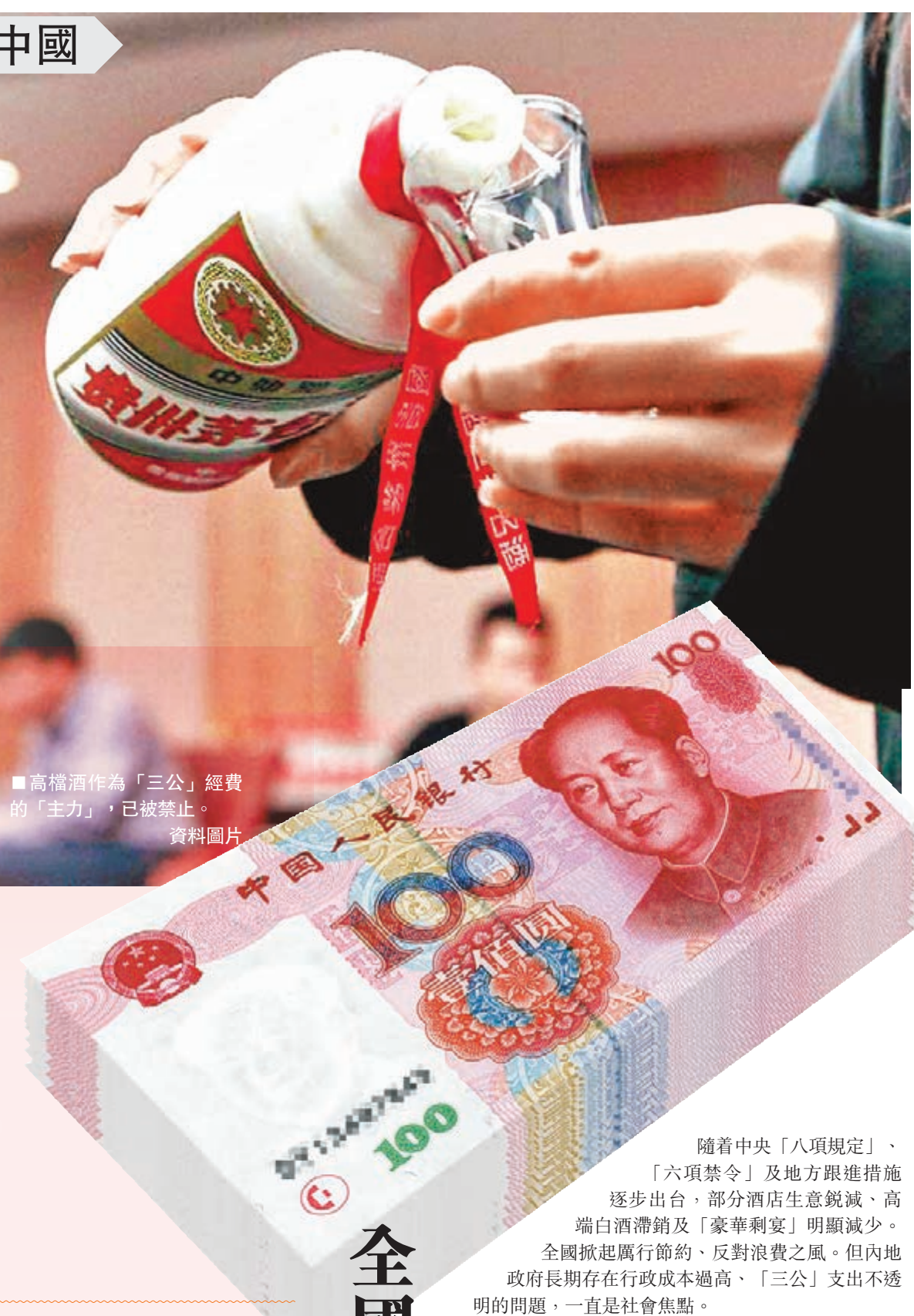
高檔酒作為「三公」經費的「主力」，已被禁止。