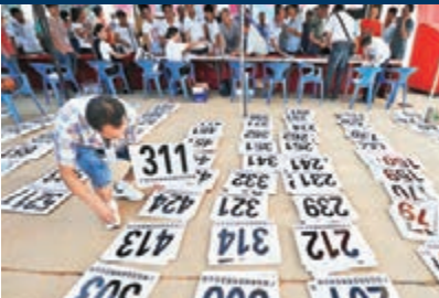
廣西柳州市柳南區公務用車拍賣會，工作人員在發放競拍號牌。

針對政策下的各種「對策」，一些省市採取了將網路監控系統接入各單位和定點場所，每次消費時間、地點、金額等均可在網上查看，在酒店點了甚麼菜、商店買了甚麼土特產、汽車維修花了多少錢等等，點擊監控系統，一目了然。而且消費超過預算(前三年消費平均數平均下調10%後作為預算標準)就會預警，並要求當場結賬，只有消費清單、稅務發票和刷卡小票齊全且時間一致，才可報銷。 預算合理 支出公開 但要真正做到反腐和廉政建設，必須建立合理的預算和支出公開制度，強化公眾和社會的監督力。同時也要將樹立勤儉節約作為執政理念，建立三公經費支出預警機制。 此外，紀檢、監察、財政、審計等部門應加大聯合檢查力度，對各單位財政資金支出審批、報銷、核算實行源頭審核控制，並積極探索建立對三公經費支