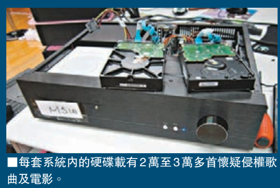
每套系統內的硬碟載有2萬至3萬多首懷疑侵權歌曲及電影。

然而，有人圖為了避過執法人員偵查，以及防止客戶擅自抄錄系統內置的侵權歌曲及電影，特為系統加上保護裝置，限定客戶必須使用該公司提供的USB硬件及密碼，才可啟動系統。