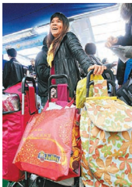
朱小姐表示，在早上6時便和朋友從廣東順德趕來香港。