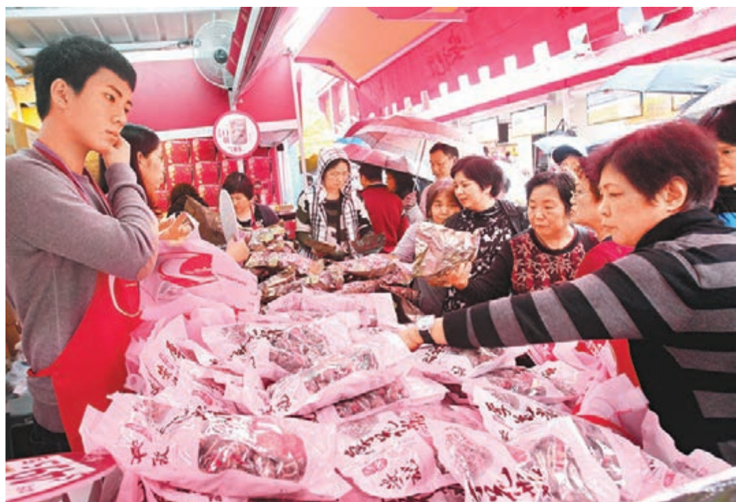
工展會開鑼兩日，有賣參茸海味的商戶表示，受天雨影響人流至少比往年下降20%，但因入場人士購買力強，加上不少「大家客」光顧，故對生意額影響不大。

來自廣州的李氏一家專程來工展會「掃貨」，燕窩、參茸海味、湯包、零食、羽絨、鞋全為囊中物，合共花費逾5,000元，李太太指，只逛了半個工展會會場，仍會周圍看看有甚麼「抵買」。莫太太則飲完茶後，與兒子來工展會逛逛，並無打算購物，但場內貨品優惠吸引，最終買了一架手拉車分量的麵食。