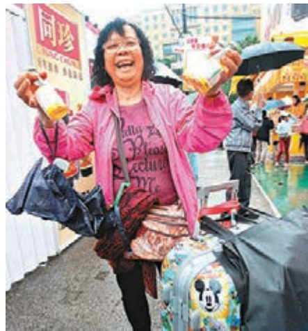
潘權輝認為不少人專程前來辦年貨，雖首日受天雨影響，但較往年有20%升幅。