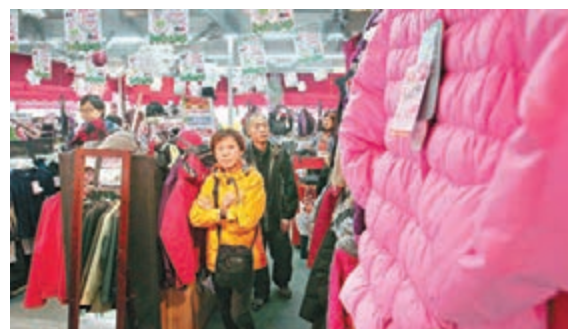
因天雨關係，較多客人轉買防水防風型的多功能羽絨，故攤檔生意額能保持水平。