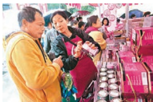
冒雨前來的市民和旅客，聽店員詳細介紹貨品。