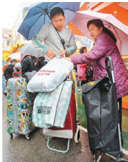
有公共屋邨「包車」接送居民到工展會，把握機會「掃貨」抗通脹。