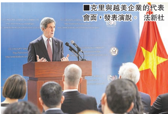
克里與越美企業的代表會面，發表演說。

薩基日前表示：「東南亞在亞太均勢之間的角色特別重要，國務卿的越南與菲律賓之行，彰顯美國對這個區域的長遠承諾。」