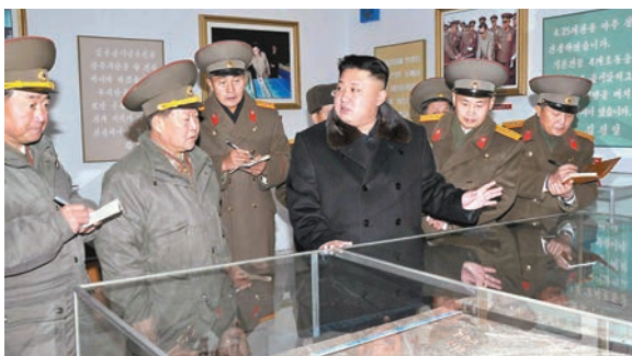
金正恩視察時，崔龍海(左二)一直陪伴在側。

韓國《朝鮮日報》報道，韓國政府和軍方昨紛紛召開緊急國家安全政策調整會議，着手研擬應對政策，包