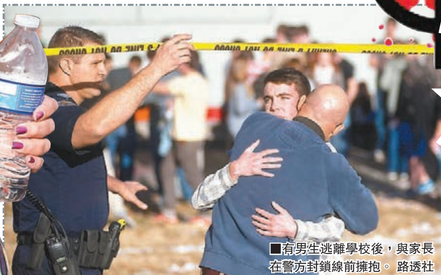
有男生逃離學校後，與家長在警方封鎖線前擁抱。