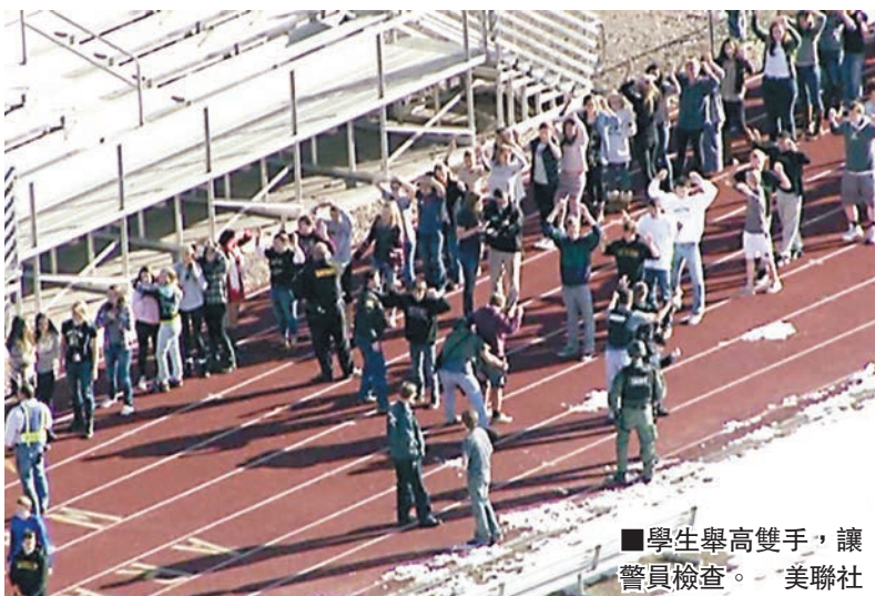
學生舉高雙手，讓警員檢查。