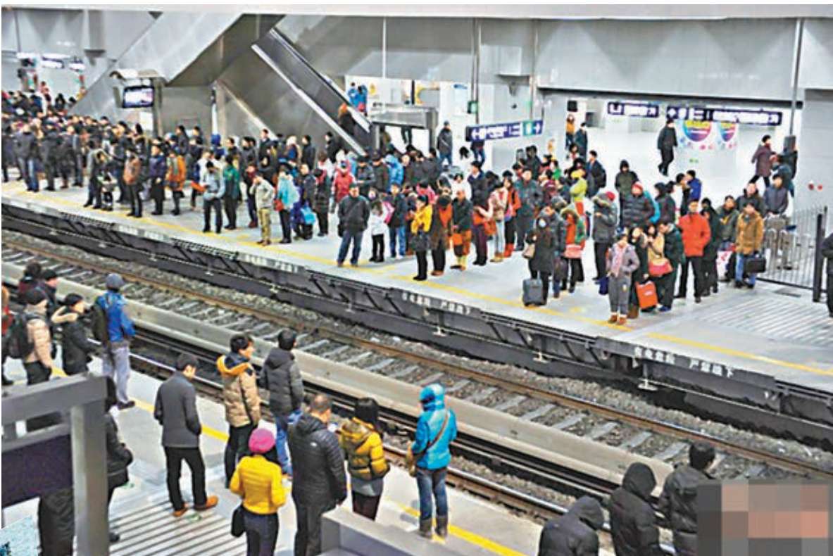
■北京地鐵早高峰「衆生相」。圖為北京地鐵西二旗站人潮。