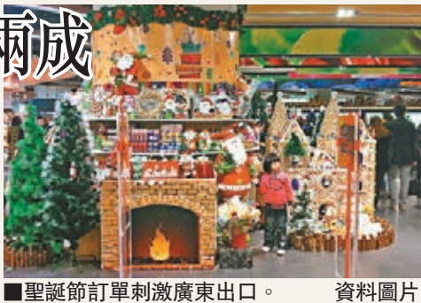
■聖誕節訂單刺激廣東出口。資料圖片