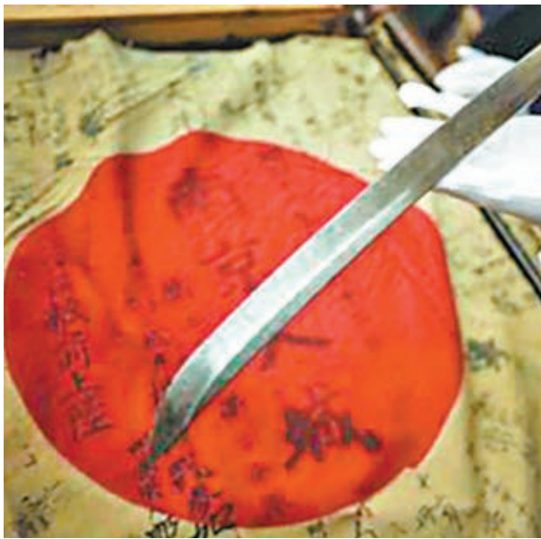
■南京大屠殺遇難同胞紀念館獲捐的日軍軍旗和軍刀。