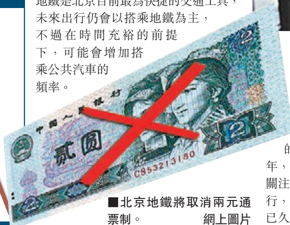
■北京地鐵將取消兩元通票制。