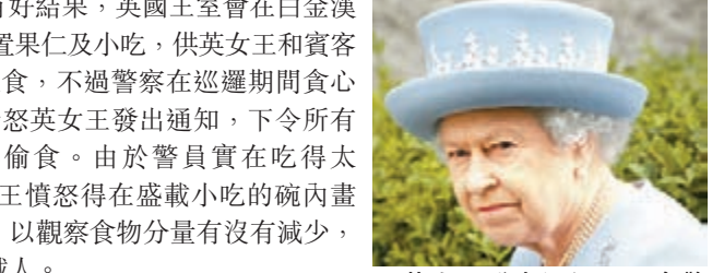
英女王發出通知，下令警員不得偷食。美聯社

偷食沒有好結果，英國王室會在白金漢宮走廊放置果仁及小吃，供英女王和賓客經過時進食，不過警察在巡邏期間貪食偷吃，觸怒英女王發出通知，下令所有警員不得偷食。由於警員實在吃得太多，英女王憤怒得在盛載小吃的碗內畫出界線，以觀察食物分量有沒有減少，並找出賊人。 警員沒有奉公守法的事件，隨着新聞集團竊聽案前日在英國法院續審而曝光，控方在庭上讀出2005年一封包含上述內容的電郵，作為集團報章王室記者竊聽的證據。 ■路透社/美聯社