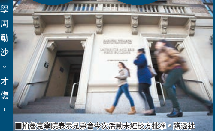
柏魯克學院表示兄弟會今次活動未經校方批准。

美國紐約市立大學柏魯克學院一名華裔男生，在過去的周日參加校內兄弟會迎新活動時，被強迫背上約9公斤重的沙包，遭成員群毆致不省人事。在場30名同學延至一小時後才將他送院，又向警方虛報受傷原因。該男生周一傷重死亡，警方展開調查。