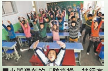
■小學獨創的「防霾操」被網友嘲笑。

內地各地近日遭受霧霾籠罩，河北石家莊光明路小學獨創了一套「防霾」武術健身操，稱可以排解肺部有害物質，具有防霾效果。對於這套神奇的防霾操，網友們大呼奇葩。有人吐槽「萬能板藍根」又來了，還有网友笑道「還不如吃青菜」。吃青菜又是什麼呢？原是一位网友為了讓妹妹愛吃青菜，發動群眾讓大家在百科裡寫吃青菜能幫助防霧霾。看來，這套防