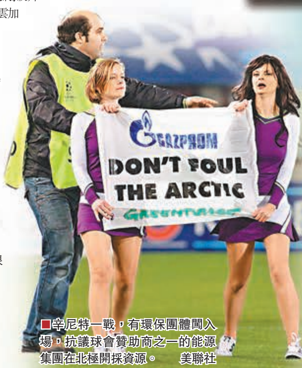
辛尼特一戰，有環保團體闖入場，抗議球會贊助商之一的能源集團在北極開採資源。