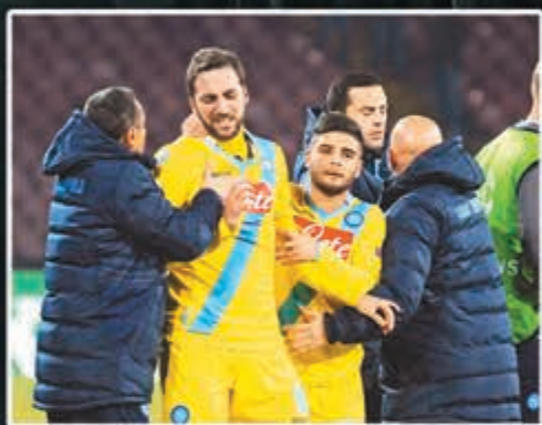
希古恩(左二)賽後淚灑當場。

今屆歐聯F組的確死亡之組，在這次三雄只能活兩隊的生死決中，結果拿玻里成了12分高分出局的隊伍。這支意甲勁旅在本港時間昨晨歐聯最後一輪分組賽下半場入兩球贏客隊阿仙奴2:0，同組多蒙特險勝馬賽2:1。阿仙奴飽吃驚風散，雖未再失1球出局，但只能屈居「蜂軍」之後次名出線，16強抽籤將硬撼拜仁慕尼黑、皇家馬德里、巴塞羅那、巴黎聖日耳門或馬德里體育會這些首名勁敵。