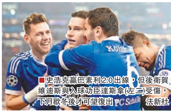
史浩克贏巴塞利2:0出線，但後衛賀維迪斯與中場功臣達斯拿(左三)受傷，下月歐戰後才可望復出。

仁會對加隊、奧軍、阿仙奴、辛尼特或A米，次名曼城會對皇馬、巴黎聖日耳門(PSG)、多蒙特、馬體會或巴塞。E組首名車路士會對利華、加隊、奧軍、辛尼特或A米。H組首名巴塞會對利華、加隊、奧軍、曼城、史浩克、阿仙奴或辛尼特，次名A米會對曼聯、皇馬、PSG、拜仁、車仔、多蒙特或馬體會。