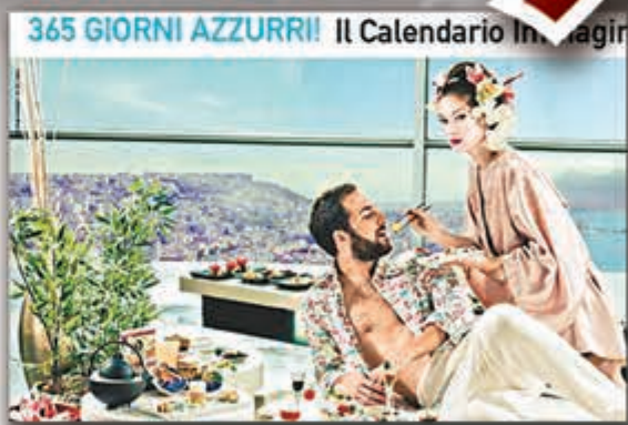
拿玻里球隊新月曆大玩美女元素，當中希古恩豪飲日本藝伎「殘廢餐」。但歐聯後恐怕他也沒甚麼胃口了。