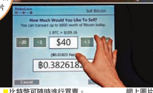
■ 比特幣可隨時進行買賣。網上圖片