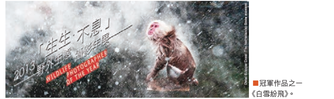
■冠軍作品之一《白雲飛舞》。

「野外生態攝影大賽」是由英國的自然歷史博物館和英國廣播公司聯手舉辦的，每年舉辦一次，展覽以促進觀察、理解和負責任地享受自然世界為主題。「野外生態攝影大賽」今年踏入第49個年頭，澳門科學館成爲了最新一屆得獎圖片在亞洲展覽的第一站。 2013年，比賽共收到來自96個國家的業餘及專業攝影師所拍攝的超過4.3萬份作品，其中優秀的100份作品將會在「野外生態攝影年展」中公開發展。展覽利用燈箱輔助展示每幅作品，以營造出一個理想環境，讓觀眾欣賞野外生態圖片所表達出來的大自然美態、多樣性和戲劇性。