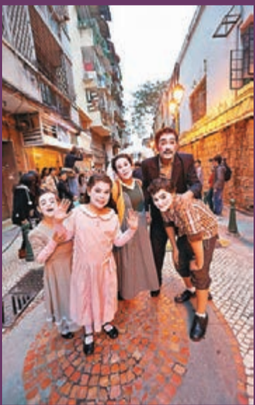
■小朋友們也樂在其中。

觀眾可在多個景點加入巡遊路線，感受大巡遊的歡樂氣氛；大三巴街搖身一變成爲戲劇大師的舞臺，以逗趣的「快樂臉譜」街頭表演與眾同樂；花王堂前地亦化身成「魅力大舞臺」，熱情的拉丁舞步，舞姿多彩的秧歌舞、火辣辣的肚皮舞叫目不暇給；老人院前地「迷人音樂SING」以清脆悅耳的手鈴聲觸動心靈；茨林園上演街頭「熱舞大比拼」，為巡遊的熱鬧氣氛加溫；高圍街有「高圍好音樂」，中西音樂、光影映照；美蘭街「葡韻風情畫」帶來葡國風味音樂，配合色彩奪目的土風舞裝飾，美艷如畫；仁慈堂琴仔屋「瘋堂仙魂」，以優雅舞姿致敬人忘卻城市的煩瑣；高人一等的「創意大木偶」麗麗瘋堂新街，與大小朋友一起熱舞；終點塔石廣場「高跳達人SHOW」上演凌空舞步，教人歎為觀止，而中間大型舞台則有4個巨型木偶守護神，與海內外的巡遊隊伍華麗演出以「愛、和平、文化共融」為理念的開幕式，以精湛的表演回歸禮禮，並為大巡遊劃上完美句號。