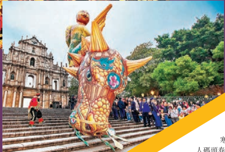
■巡遊路線出發點——澳門大三巴。