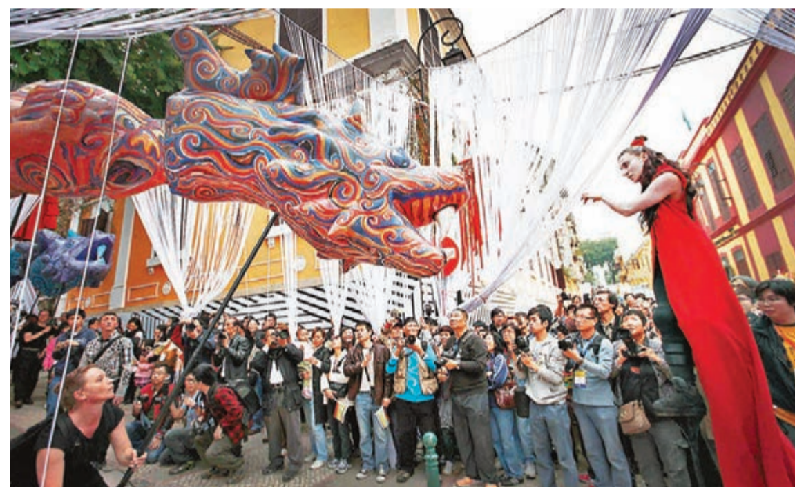
■每年「澳門拉丁城區幻彩大巡遊」都吸引眾多居民和遊客參與狂歡。