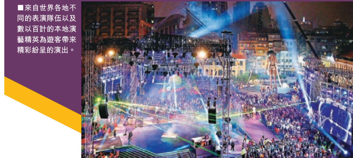
■來自世界各地的表演隊伍以及數以百計的本地演藝精英為遊客帶來精彩紛呈的演出。