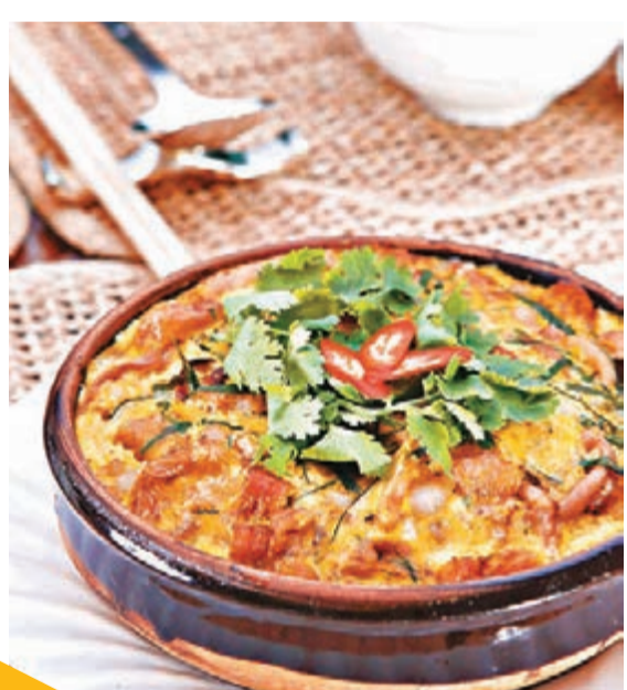
■精心挑選肥美不黏特製而成的秋冬燻不燥，配上清香的雞蛋，滋陰補腎。