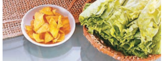
■古法羊腩煲選取新鮮的黑山羊，肉質嫩滑多汁，嚼勁十足，鮮而不膩。

寒冬將至，食之暖適上心頭。澳門漁人碼頭春秋火鍋及龍滷軒推出一系列禦寒滋味佳餚，令今冬不再寒冷。 冬季既寒冷又乾燥，當然要滋補一下。秋冬燻不燥，精心挑選肥美不黏特製而成的，禾蟲含豐富蛋白質配上清香的雞蛋，滋陰補腎；菊花五蛇羹，具有活血補氣、舒筋活絡功效，蛇羹味道鮮美，吃時加上菊花絲，使其濃郁芬芳。此外少不了在冬季菜式中不可或缺的煲仔飯，由不同新鮮食材配製烹製出多種獨特的風味，是一絕的選擇。其中，香芋臘味煲仔飯觀乎頭配上臘味，在炊製過程中，芋頭的澱粉質將臘味的油分完全吸收，令菜式香味俱全，而古法羊腩煲是選取新鮮的黑山羊，其肉質嫩滑多汁，嚼勁十足，再配以腐乳能提升其鮮味，鮮而不膩是黑山羊的獨有風味，最適合秋冬進食。