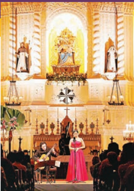
■每逢聖誕節期間，玫瑰堂都會上演精彩的聖誕音樂會。

澳門是東亞地區歷史悠久的教區，有「聖城之城」美譽，每逢聖誕全城更是流光溢彩，到處都有燈飾、聖誕樹等擺設，宗教氣氛濃厚。平安夜(12月24日)主教座堂舉行子夜彌撒，之後最佳音隊伍穿城全城，途經許多南歐及中式建築，親身感受澳門獨特的中西共融，一起迎接聖誕節。 佳音處處的晚上，若有美妙音樂相伴更顯歡心樂事，澳門樂團為各位樂迷送上「聖誕節音樂會」(12月17日晚8時、文化中心綜合劇院)。此外，澳門中樂團「聖誕樂聲」音樂會(12月19日晚8時、玫瑰堂，免費門票於演出前兩小時在演出場地門前派發)，以妙韻琴音，引領您進入奇妙的聖誕音樂之旅。