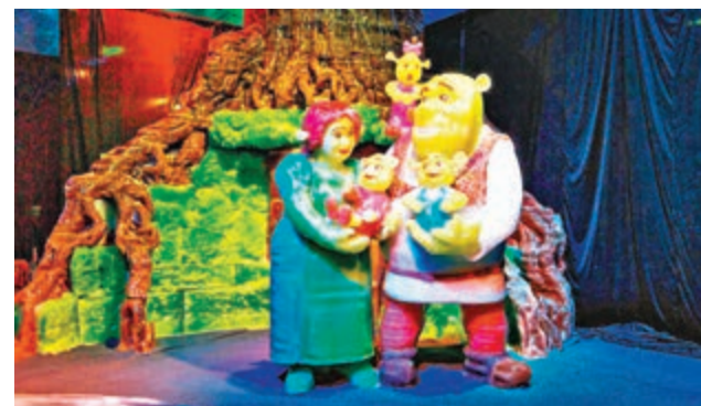
■DreamWorks動畫明星史力加和他的家人。

開演：12月24日至26日 劇團：21日(唐帕斯詩琴)、24日及25日《蝙蝠》、26日《世界喜歌劇峰會》 地點：金沙劇場