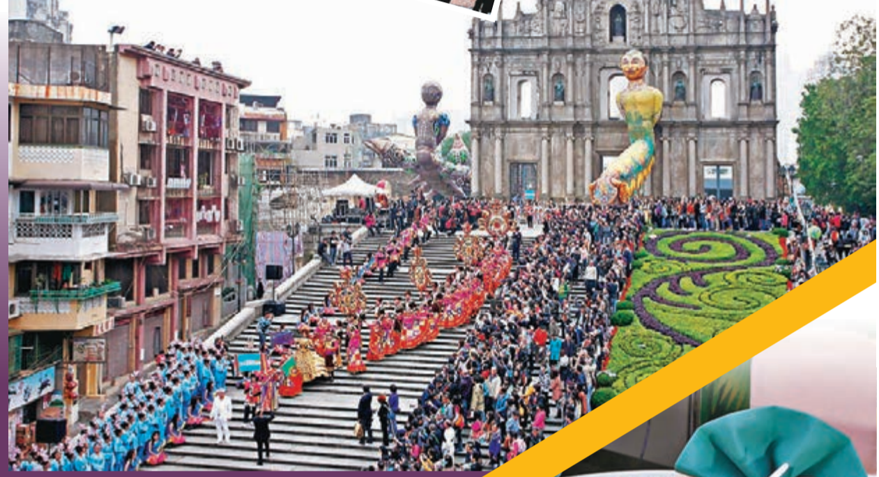
■大三巴街搖身一變成爲載歌載舞的世界，與眾同樂。