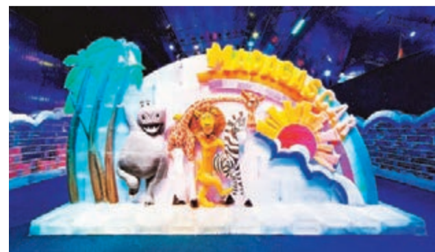
■《荒失失奇兵》的亞力獅和他的朋友們。