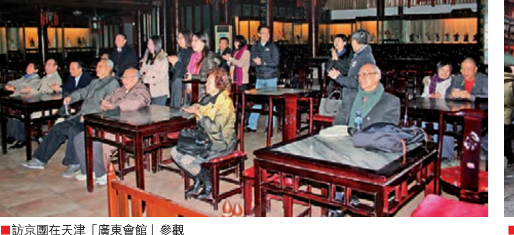
■訪京團在天津「廣東會館」參觀。