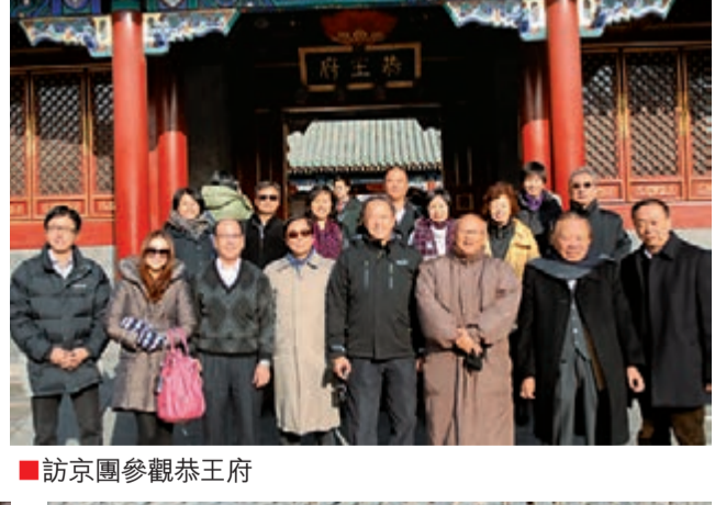
■訪京團參觀恭王府。