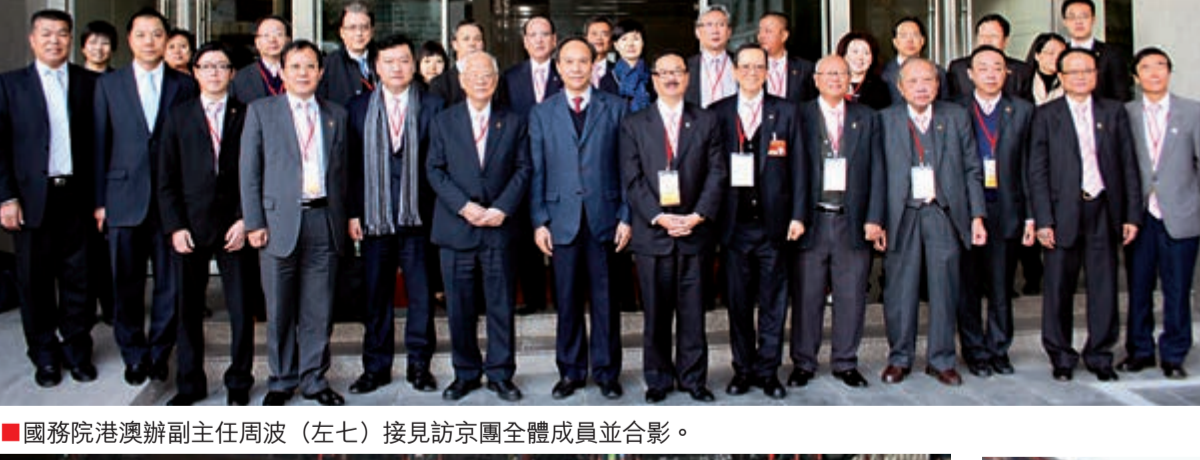
■國務院港澳辦副主任周波（左七）接見訪京團全體成員並合影。