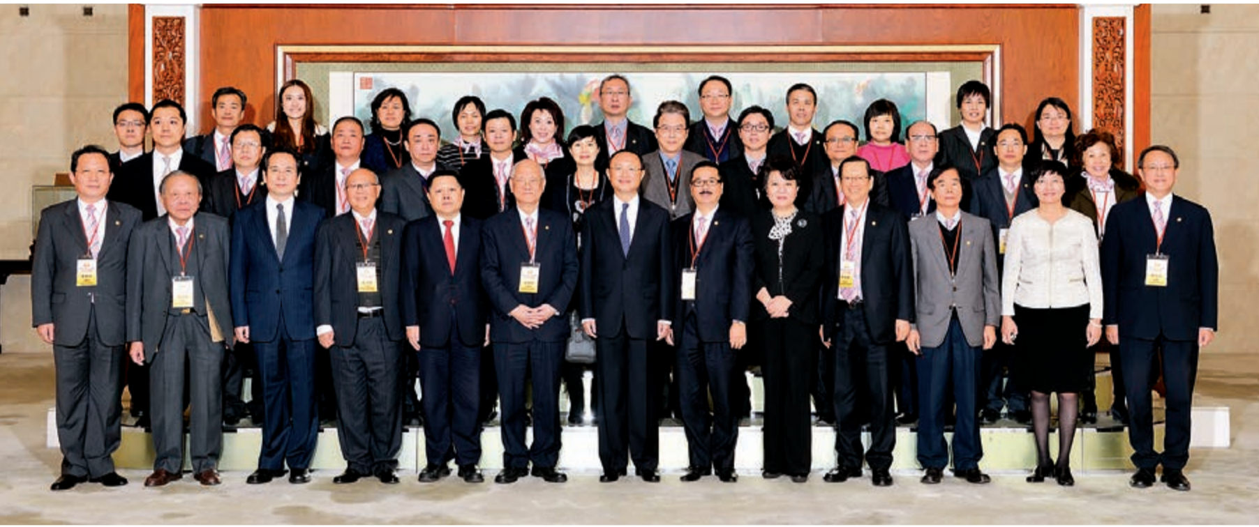
■國務委員楊潔篪（前排中）、國務院僑務辦主任裘援平（前排右五）及國務院僑務辦副主任譚天星（前排左三）等接見香港潮州商會訪京團全體成員。