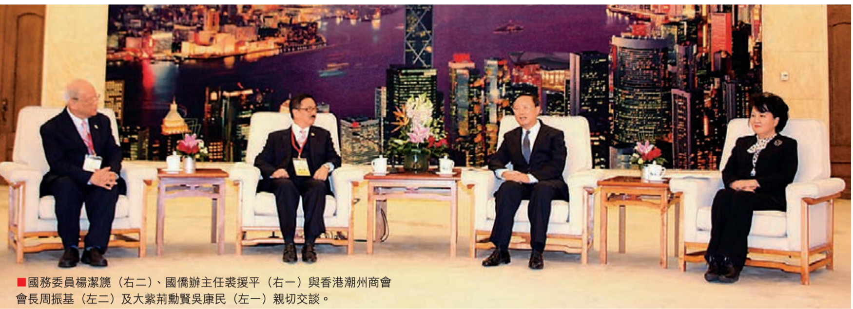
■國務委員楊潔篪（右二）、國務院僑務辦主任裘援平（右一）與香港潮州商會會長周振基（左二）及大眾勳賢吳康民（左一）親切交談。