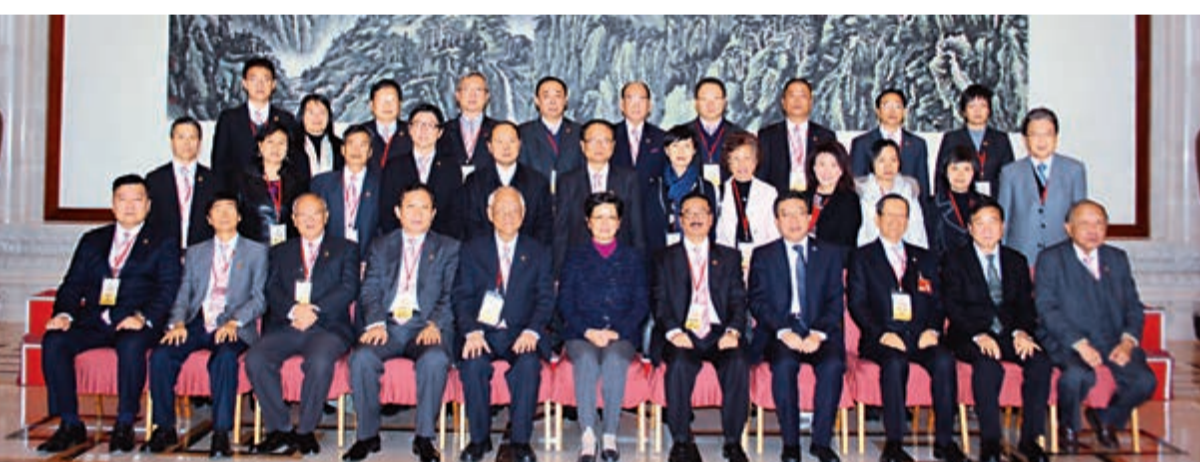
■中央統戰部副部長林智敏（前排中）接見訪京團全體成員。

訪京團一行於11月29日抵京，出席了「2013天下潮商經濟年會」及2013傑出潮商頒獎典禮等活動之暇，乘高鐵前往天津參觀「周恩來鄧穎超紀念館」、廣東會館及文化古街等，在享譽中外的狗不理餐廳大快朵頤。並到北京胡同乘人力車，遊覽王府，增廣見聞，一連五天多姿多彩的訪問取得圓滿成功。