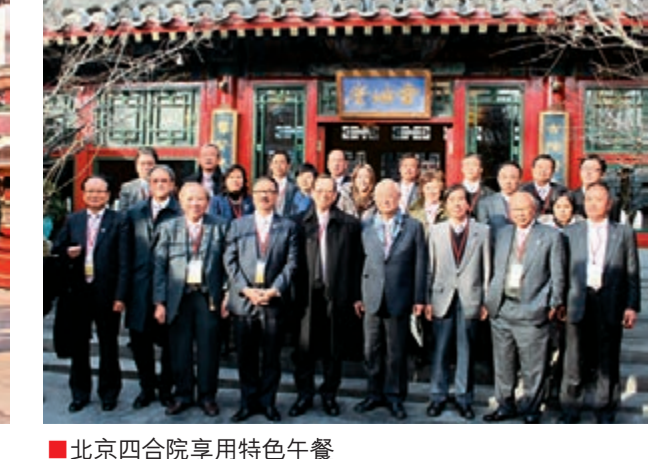
■北京四合院享用特色午餐。