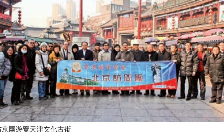
■訪京團遊覽天津文化古街。