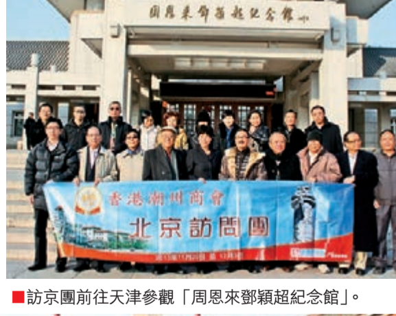
■訪京團前往天津參觀「周恩來鄧穎超紀念館」。