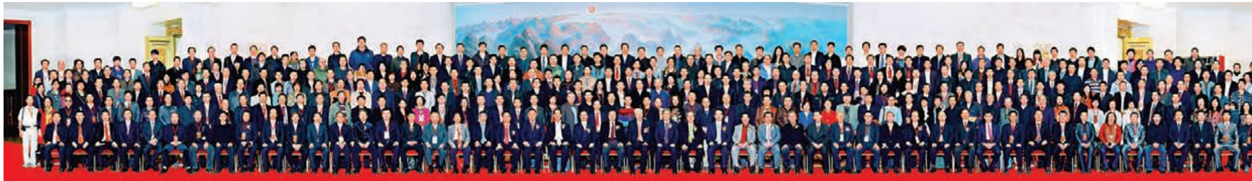
■香港潮州商會訪京團參加「2013天下潮商經濟年會」，與中央領導及600多位來自世界各地的潮商合影。