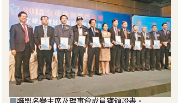
聯盟名譽主席及理事會成員獲頒證書。

香港文匯報訊（記者 柯景風 澳門報導）由全球商報聯盟、《香港商報》及《經濟導報》聯合主辦的「2013年全球商報經濟論壇」日前假澳門旅遊塔會議中心舉行。論壇以「全球經濟展望與區域經濟合作」為主題，吸引了來自海內外數百名精英專家論道。該論壇已舉辦第四屆，本屆論壇包括主題演講、話題沙龍等多個環節。