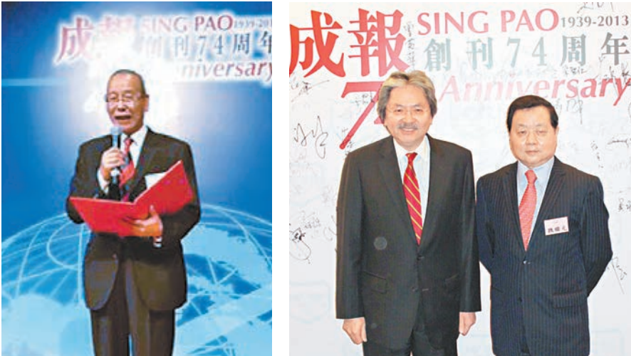
《成報》慶祝創刊74周年，田炳信致辭。香港財政司司長曾俊華到賀，與總編輯魏繼光合影。

參與酒會的立法會議員則有：立法會主席曾鈺成，民建聯主席譚耀宗，新民黨主席葉劉淑儀，民主黨前主席何俊仁，以及林健鋒、石禮謙、張宇人、馮檢基、葉國謙、廖長江、黃定光、林大輝、梁美芬、吳亮星、易志明、姚思榮、葉建源、葛珮帆、潘兆平、蔣麗芸、盧偉國、謝偉銓等。