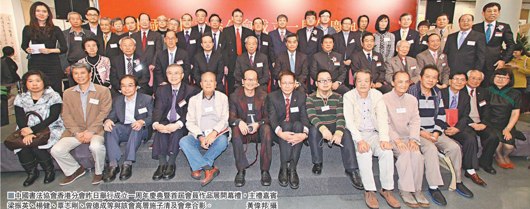
中國書法協會香港分會昨日舉行成立一周年慶典暨首屆會員作品展開幕禮，主禮嘉賓梁振英、楊健、覃志剛、曾德成等與該會高層施子清及會眾合影。

香港文匯報訊（記者 陳熙）中國書協香港分會昨日假中央圖書館展覽廳隆重舉行成立一周年慶典暨首屆會員作品展，特首梁振英，中聯辦副主任楊健，中國文聯黨組副書記、副主席覃志剛，中國書協副主席蘇士澍，香港民政事務局長曾德成等為展覽剪綵，與近300名各界人士、藝術家、書法愛好者一同欣賞書法作品，場面十分熱鬧。