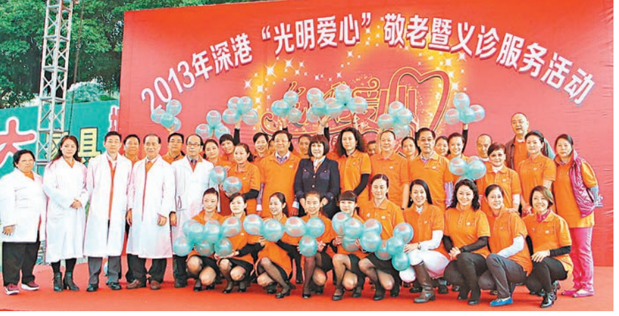
香港慈善總會、香港華夏醫藥學會、國際中醫中藥總會舉辦2013深港攜手義診送溫暖慈善敬老活動。