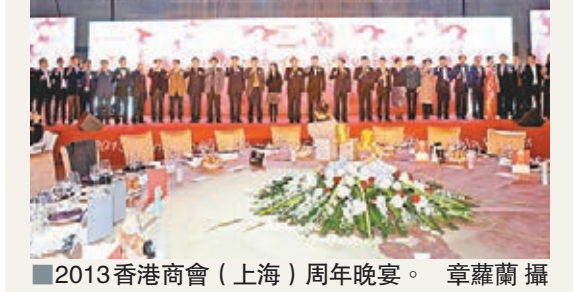
2013香港商會（上海）周年晚宴。

展望2014年，駐滬辦將繼續與商會共建一個暢順的溝通渠道及便利營商的平台，在良好合作的基礎上，進一步為港商在內地營商創造更廣闊空間。