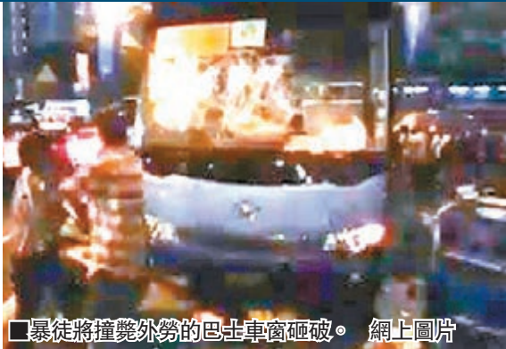
■暴徒將撞斃外勞的巴士車窗砸破。