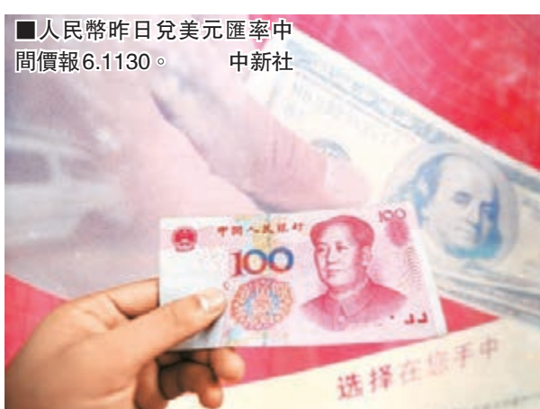
■人民幣昨日兌美元匯率中間價報6.1130。

此外，根據世界銀行金融電訊協會（SWIFT）昨日發佈的報告顯示，2012年11月時，人民幣在國際貿易融資（主要包括信用證和託收）中所佔的份額僅為1.89%，