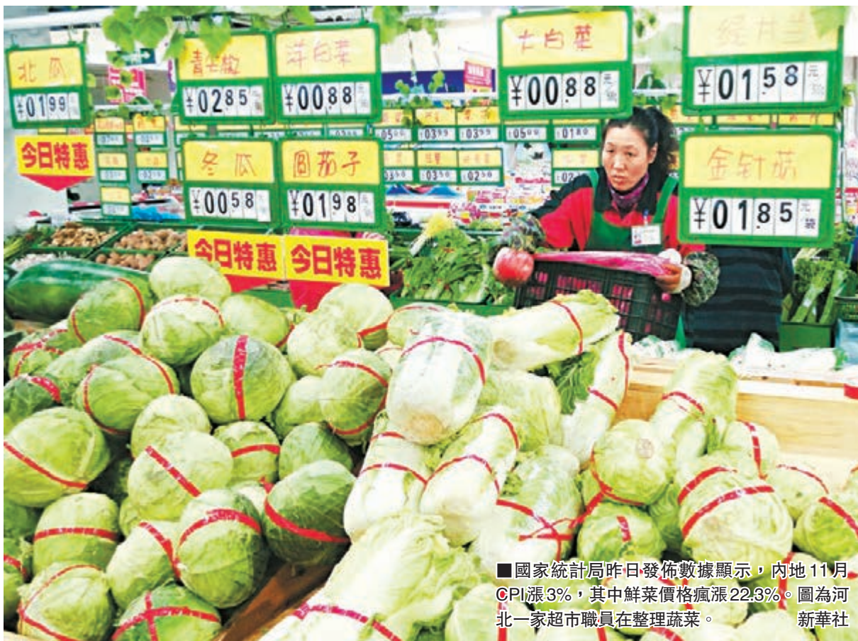
■國家統計局昨日發佈數據顯示，內地11月CPI漲3%，其中鮮菜價格漲22.3%。圖為河北一家超市職員在整理蔬菜。

不過專家亦分析指出，今冬為暖冬，11月蔬菜、鮮肉價格同比漲幅實際低於往年，且現在菜價呈現北漲南落趨勢，東北地區受入冬以來最強降雪影響，西北部分地區或低溫或多雨，蔬菜價格環比上漲較多，而華東、中南和西南地區蔬菜價格環比普遍有所下降。廣東、湖南、湖北、河南等省份供港蔬菜主要供應地，已呈現蔬菜價格環比下降趨勢。