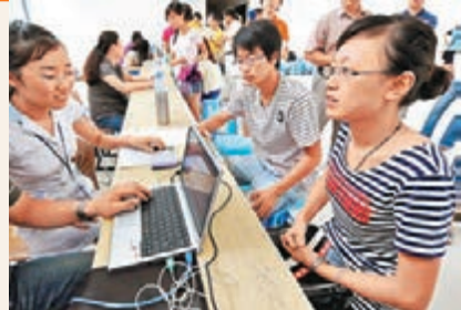
貧困生在南京東南大學貧困生入學綠色通道辦理手續。