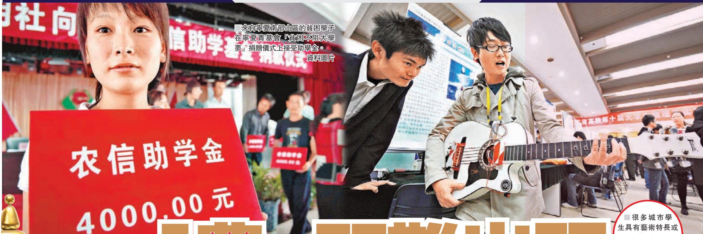
來自寧夏南部山區的貧困學子在寧夏青基會「貧困不阻大學夢」捐贈儀式上接受助學金。資料圖片