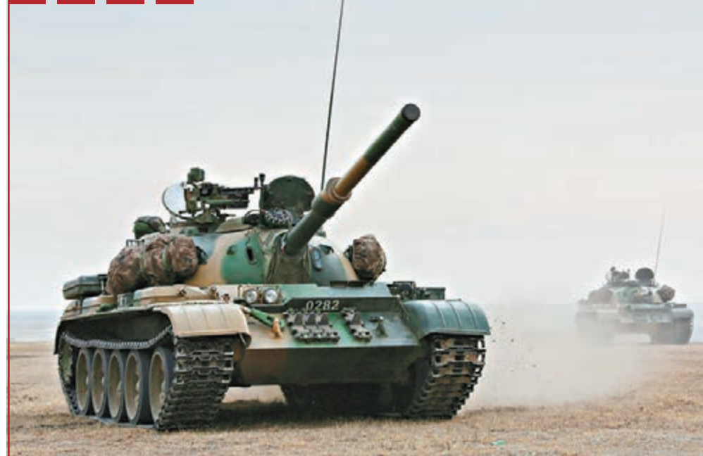
■昨日，瀋陽軍區某機步旅頂着凜冽寒風在科爾沁草原八百里瀚海展開紅藍實兵對抗演練。該旅緊貼實戰需求，藉助激光模擬對抗系統，全面提高官兵嚴寒條件下的實戰能力。