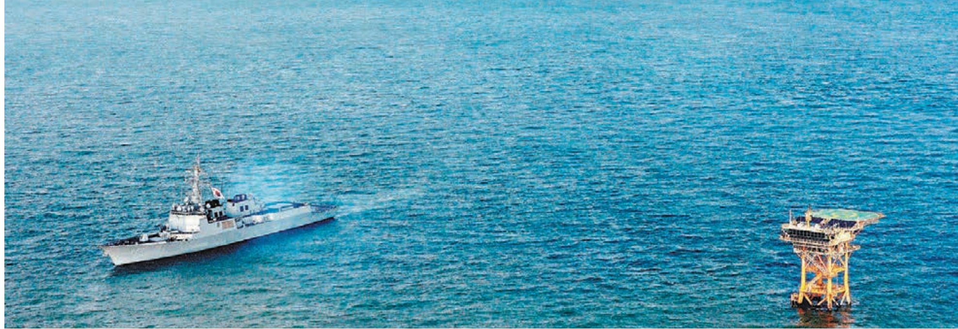
■韓國昨日發佈防空識別區擴大方案，新擴大的區域不僅覆蓋與中國有主權爭議的蘇岩礁，也涵蓋日本防空識別區。圖為韓艦隻和飛機巡航蘇岩礁海域。

美國副總統拜登訪華時表示，關於防空識別區，目前球在中國手中。對此李侃如就表示，目前美國方面的關切重點是中國下一步將如何更清晰地定義防空識別區內的規則，同時也希望能在東北亞地區建立多邊參與的危機管理機制，以應對分歧緩和和緊張。