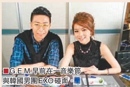
G.E.M.早前在一音樂節與韓國男團EXO碰面。

香港文匯報訊(記者凡文)G.E.M.亮相TVB Good Show台節目《6號訪》，接受主持陸浩明的訪問。G.E.M.早前被前輩級歌手甄妮公開批判她目中無人，惹來一場風波，問G.E.M.日後再遇甄妮會主動解釋？她說：「我會先打招呼，因為主要問題都出於打招呼。」她又表示，早前到韓國參加演出，在後台見到韓國當紅男子組合EXO，他們很有禮的輪流向她鞠躬，令她受寵若驚，G.E.M.說：「原來這是韓國演藝界的文化，因為我出道比他們早，所以他們會向我鞠躬以示尊敬。」G.E.M.自言會多多學習。