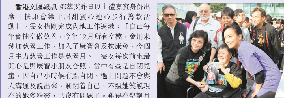
鄧萃雯大受在場人仕歡迎。

香港文匯報訊 鄧萃雯昨日以主禮嘉賓身份出席「扶康會第十屆甜蜜心連心步行籌款活動」。雯女指剛完成內地工作返港：「自己每年會抽空做慈善，今年12月所有空檔，會用來參加慈善工作，加入了康智會及扶康會，今個月主力慈善工作是慈善月。」雯女每次前來最開心是與康智小朋友合照，當中有些是自閉兒童，因自己小時候有點自閉，遇上問題不會與人溝通及說出來，關閉着自己，不過她笑說現在的她多精靈，已沒有問題了。難得在聖誕月放假，雯女指會跟朋友聚會度聖誕。