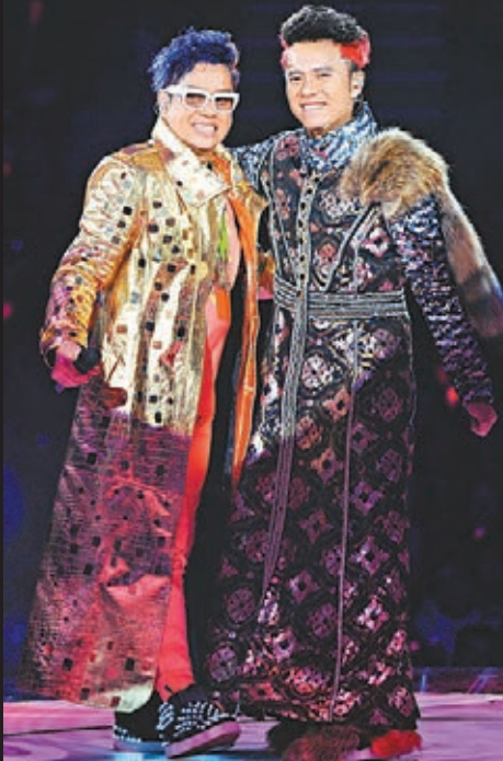
相隔4年，左麟右李再合體以歌會友兼放笑彈。

相隔4年，左麟右李前晚再度假紅館舉行首場合體騷，黃子華、杜麗莎與女兒及阿倫母親陳珍妮等皆是座上客，二人亦獲得南京、廣州等地的內地歌迷到場支持。主辦單位非常貼心，於舞台兩側位置安排超級VIP區，讓歌迷可近距離與阿倫及克勤接觸。