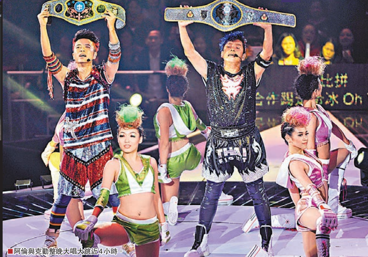
阿倫與克勤整晚大唱大跳近4小時。

香港文匯報訊 譚詠麟(阿倫)、李克勤一連13場《左麟右李10周年 — 香港有聲音演唱會》前晚假紅館揭開序幕，阿倫、克勤整晚大唱大跳近4小時。左麟加李今次找來黃子華任棟篤笑顧問，前晚大放笑彈成功博得全場掌聲。阿倫更罕有地擺兒子上枱，戲言怕他認識到18巴港女。