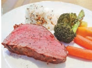
60度無火「考」牛肉配蒸彩蔬及五穀飯