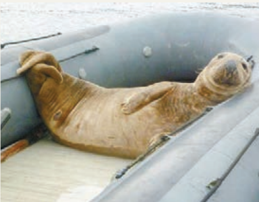
■海豹懶洋洋的樣子，十分趣怪。網上圖片