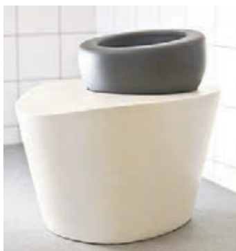
■這款廁所的外形雖然奇特，但不失美感。網上圖片

未來坐廁是什麼模樣？英國3名學童發揮創意，設計出一款外形奇特的坐廁，十足一粒戴着帽的巨型白色棉花糖，聲稱能即時化驗用家的大小便，監察糖尿病、腎病患者等的病情，甚至驗出是否營養不良或懷孕，蹲坐設計亦比傳統如廁姿勢更有益健康。