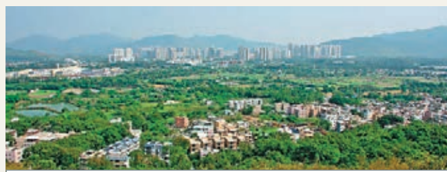
梁振英駁斥有關新界東北發展計劃的各種「陰謀論」。圖為納入發展規劃的新界古洞北區。