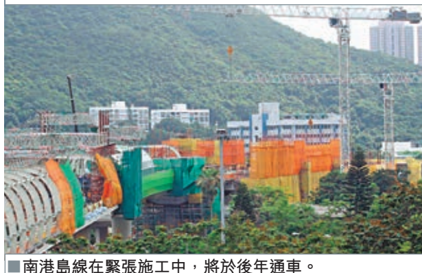
南港島線在緊張施工中，將於後年通車。

香港文匯報訊（記者 文森）在昨日港島區的施政報告地區諮詢會上，不少市民都關注地區的發展，包括西港島線和南港島線等問題，特首梁振英就「做足功課」，詳細回應了市民的關注。