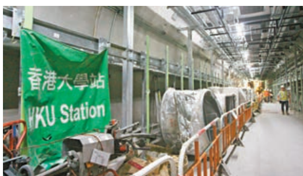
西港島線月台幕門大致安裝完成，明年啟用。