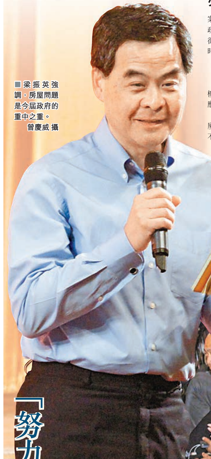
梁振英強調，房屋問題是今屆政府的重中之重。

梁振英今日會出席第三場地區諮詢會。諮詢會下午2時半至4時假大角咀旺角街坊會陳慶社會服務中心舉行，勞工及福利局局長張建宗、財經事務及庫務局副局長梁鳳儀，以及民政事務副局長許曉暉均會同行。入場券今早9時起，在大角咀埃華街休憩花園派發。