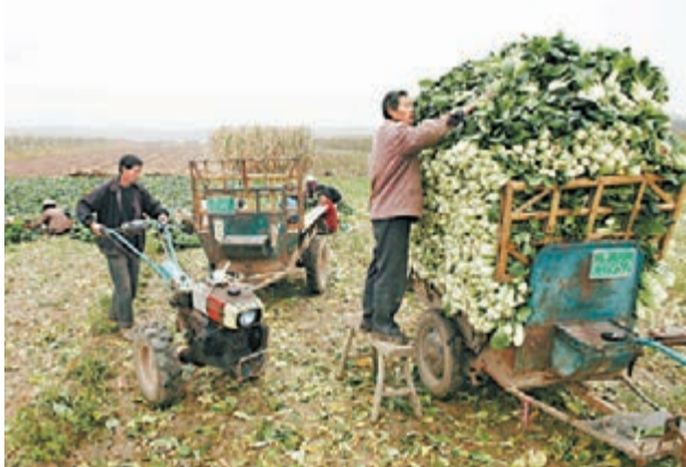
三中全會提出農村土地流轉改革,冀改善農民生活和收入。圖為山東農民在收割農作物。

「並不是說所有的農村建設用地都可以自由入市,即使是集體的經營性建設用地入市,首先也還要確權、確地,不能無證轉讓。還要規範公開的市場操作,不能私下授受。」韓長賦說。