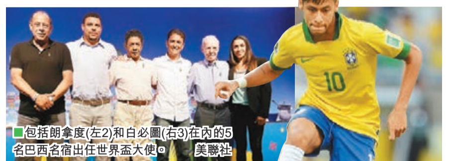
■包括朗拿度(左2)和白必圖(右3)在內的5名巴西名宿出任世界盃大使。

朗拿度、白必圖、薩加奴、阿馬利杜這4位前巴西世界盃冠軍成員5日在巴西的一場活動中一致表示, 巴西新星尼馬將成為2014年世界盃最佳球員。 曾經作為球員、技術顧問和主教練幫助巴西奪得4次世界盃冠軍的薩加奴認為, 轉會到巴塞羅那對尼馬的幫助很大。他說: 「尼馬到歐洲後, 水準提高一個等級, 讓更多人認識了尼馬。我認為巴西一定能奪冠, 而尼馬就是最佳。」