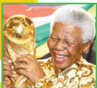
■國際足聯將於瑞士總部下半旗致哀。

南非前總統曼德拉5日逝世, 國際足聯(FIFA)主席白禮達稱足球界對曼德拉的去世表示哀悼, 在國際足聯官網發表的聲明中稱: 「曼德拉將永遠活在我們心中。」他指出曼德拉「可能是我們這一代最偉大的人道主義者之一」, 並表示曼德拉與他都堅定地相信, 足球具有讓人們和平友誼相處的非凡力量。 白禮達稱, 位於FIFA總部的209個會員國家和地區的旗幟將下半旗致哀, 在下一輪國際比賽賽前, 球隊也將進行1分鐘默哀。 ■新華社