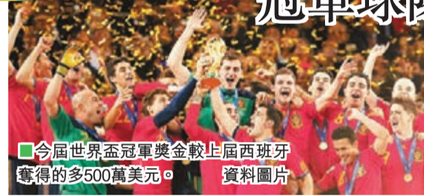
■今屆世界盃冠軍獎金較上屆西班牙奪得的多500萬美元。資料圖片

國際足聯5日公布2014年世界盃獎勵細則, 冠軍隊伍將獲得3500萬美元(約2.7億港元)獎金, 亞軍獎金為2540萬美元(約1.9億港元), 第3名和第4名分別能帶2200萬美元(約1.7億港元)和2000萬美元(約1.5億港元)回家。 與2010年的南非世界盃相比, 明年的巴西世界盃獎金數額有所增加。南非世界盃冠軍西班牙當時獲得3000萬美元獎金。2010年世界盃16支在小組賽中被淘汰的球隊, 可獲得800萬美元的「安慰獎」, 當時的總獎金額為4.2億美元, 已經比2006年德國世界盃的獎金高出60%。