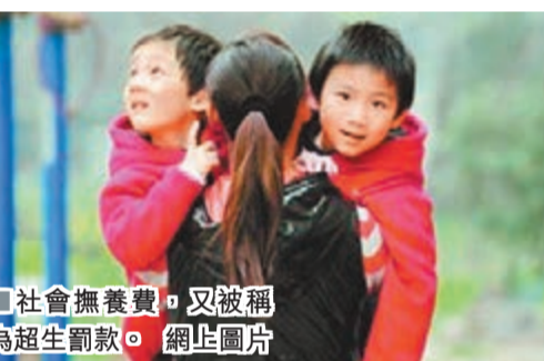
社會撫養費, 又被稱為超生罰款。

然而至今, 尚無一份省份計生或財政部門公開支出情況。多數部門給出的不公開理由是, 「社會撫養費由縣級人民政府計生部門或者委託鄉(鎮)人民政府和街道辦事處徵收, 上繳縣級國庫, 納入縣級財政預算管理, 由財政部門統一安排使用, 收入和支出不掛鉤。因此, 省級部門不掌握2012年度社會撫養費實際開支情況」。