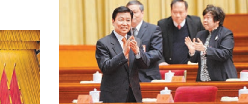
李源潮出席閉幕會議。

有人說: 三十歲的深圳老了。深圳人只有用法制建設的實際成果告訴人們: 三十歲的我依舊年輕!