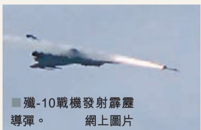
殲-10戰機發射霹靂導彈。