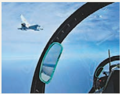
空中協同作戰。網上圖片

香港文匯報訊 解放軍東海艦隊航空兵日前在東海某海域組織一場信息化條件下的多機種合同突擊實兵實彈演練。