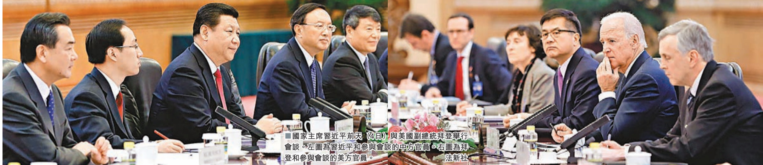
國家主席習近平(左)與美國副總統拜登(右)舉行會談。左圖為習近平和參與會談的中方官員。右圖為拜登和參與會談的美方官員。

香港文匯報訊(記者 劉坤領 綜合報導)在美國副總統拜登的訪華行程中，雖然中國東海防空識別區不是雙方最主要的議題，但卻是外界最為關注的一點。外電消息指，拜登在會談中當面向習近平表示，美國不承認中國宣布的防空識別區，希望中國「不執行」，並採取措施以「緩和緊張情勢」。習近平則向拜登表明了中國在東海防空識別區議題上的原則立場，強調中方做法符合國際法。消息稱，習近平未就「不執行」識別區做出任何承諾。中國外交部昨天再次表明，劃定東海防空識別區符合國際法，敦促美方尊重。