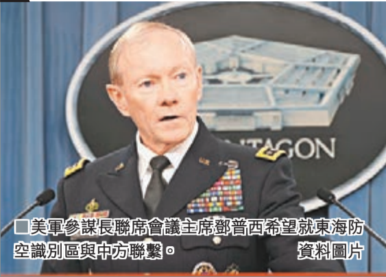
美軍參謀長聯席會議主席鄧普西希望就東海防空識別區與中方聯繫。

香港文匯報訊 美軍參謀長聯席會議主席鄧普西4日表示，美國副總統拜登5日結束訪華後，他計劃與中方聯繫，就東海防空識別區交換意見。