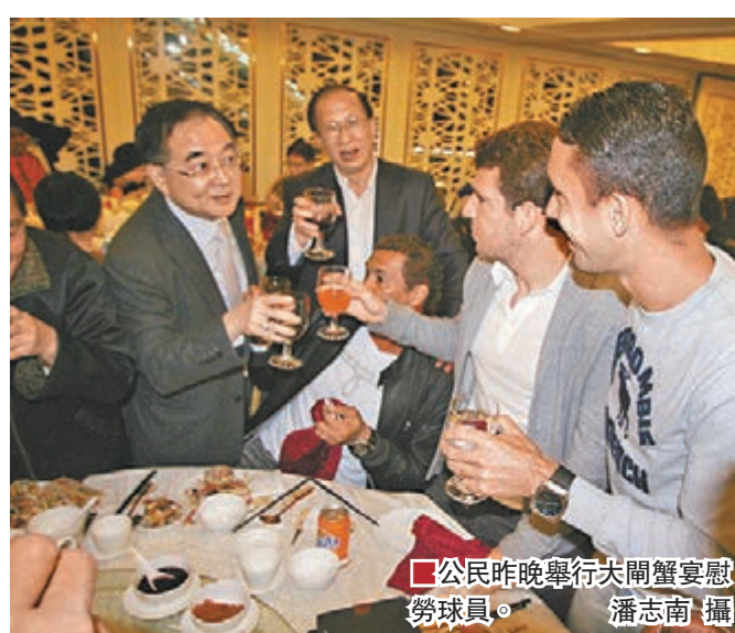
公民昨晚舉行共闡盞宴慰勞球員。

丁俊暉第3輪的對手是36號種子、愛爾蘭選手奧拜仁，後者是在前一天擊敗英格蘭球手京治晉級，兩人的比賽將在3日進行。