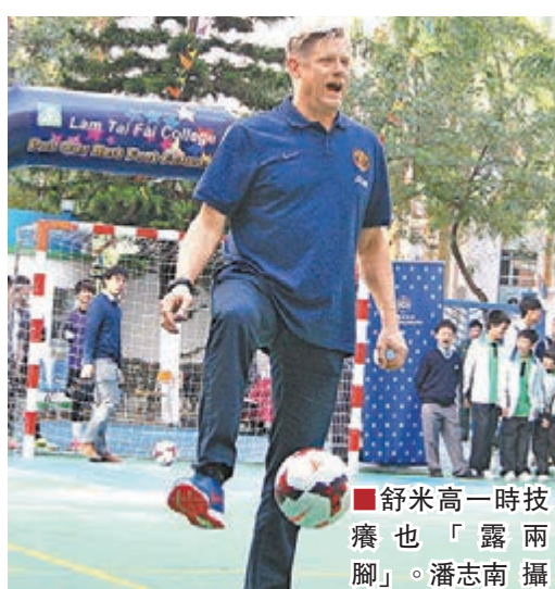
舒米高一時技癢也「露兩腳」。

雖然林大輝本身是阿仙奴的擁護者，但推廣體育文化無分界限，他感謝舒米高親自來訪本校，證明校方的工作得到認同。在訪問結束前，舒米高向校方送上親筆簽名的球衣，而學生則向他送上一幅畫作。