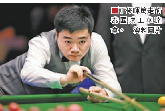
丁俊暉篤走前泰國球王華達拿。資料圖片