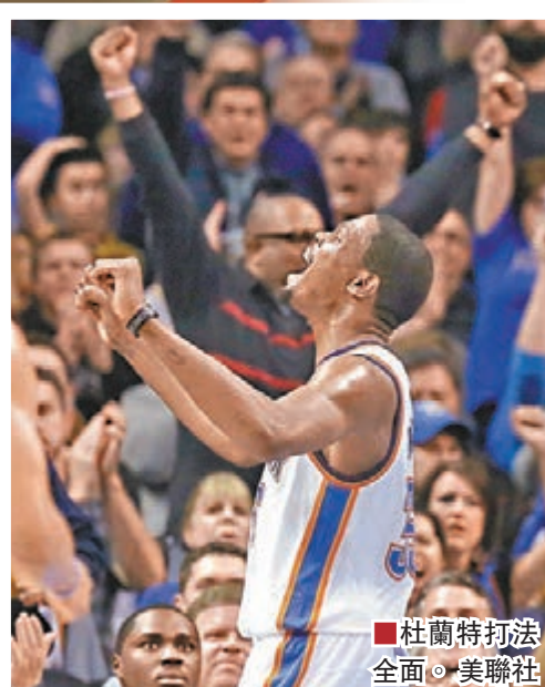
杜蘭特打法全面。