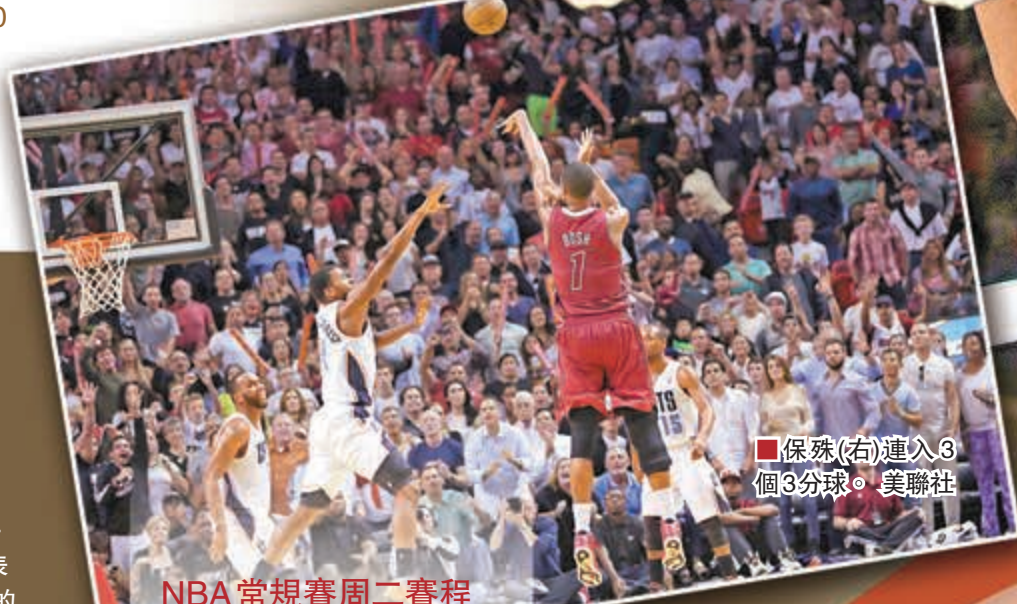
保殊(右)連入3個3分球。