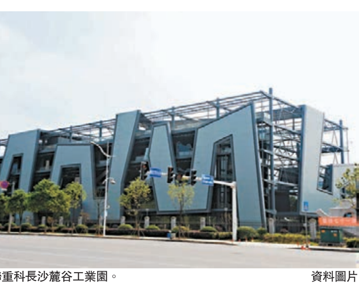
中聯重科長沙麓谷工業園。資料圖片