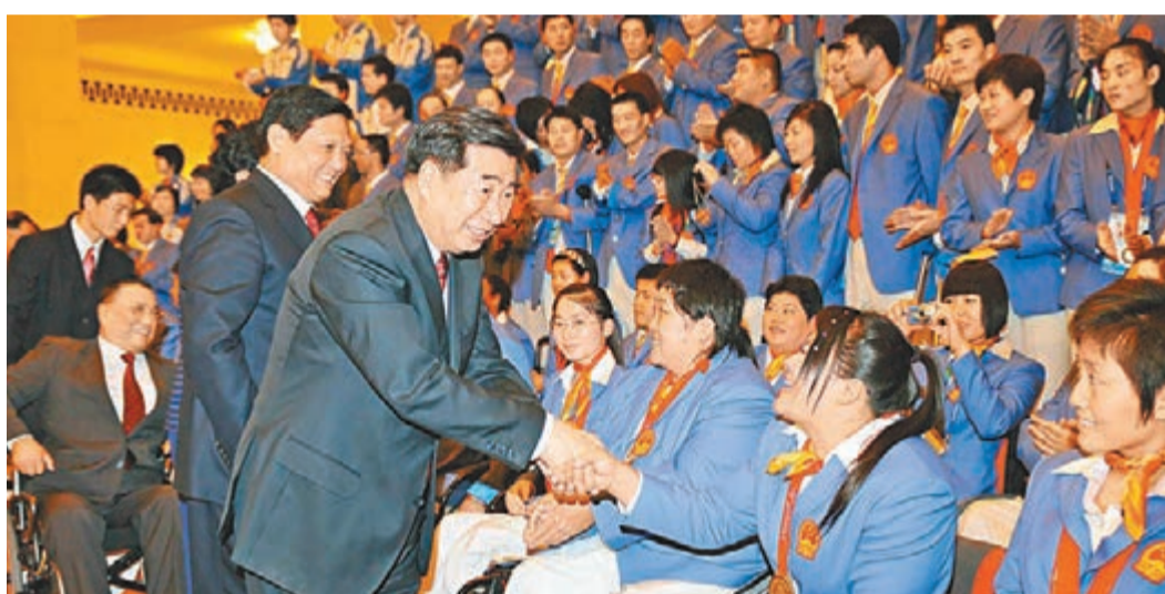
2008年9月19日,回良玉出席北京殘奧會中國體育代表團總結大會。資料圖片

回良玉說,過去的10年,中國殘疾人生存和發展狀況顯著改善。城鄉殘疾人收入保持較快增長,與社會平均水平的差距逐步縮小,上千萬農村貧困殘疾人實現脫