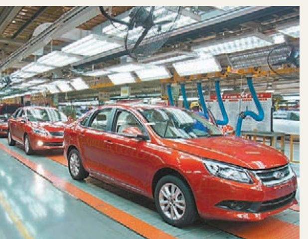
■奇瑞新款汽車艾瑞澤生產線。

香港文匯報訊(記者張長城 蕪湖報道)安徽奇瑞汽車日前陸續推出新款車型—艾瑞澤7、瑞虎5，這是奇瑞公司近三年來首次推出全新車型，也是奇瑞公司提升產品品質、實現戰略轉型的成果。今年前10個月，奇瑞汽車實現銷量38萬輛，預計全年可達到50萬輛。奇瑞汽車方面介紹，明年將重點推動老車型換代，預計將有10款新車上市。在國內生產基地的佈局中，大連工廠主要生產瑞虎5車型，明年可實現產量15萬輛，鄂爾多斯工廠主要生產風雲2車型，開封工廠主要生產開瑞微車，觀致車型則由常熟的合作工廠生產，而捷豹路虎合資項目若順利可明年上馬。總體看來，奇瑞明年可實現總產量80萬輛至90萬輛，甚至100萬輛。