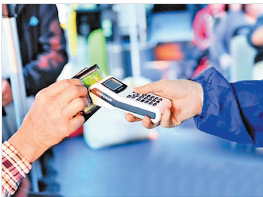
中山交通卡「中山通」轉讓公司51%股份，作價5,141萬元人民幣。本報中山傳真

據悉，中山通公司成立於2008年，是國有獨資公司，註冊資金3,000萬元，唯一股東為城投集團。主要業務是智能IC卡的銷售、充值、應用及結算，目前有18名職工。最近一期企業財務報表顯示，中山通公司總資產為8,912萬元，總負債5,653萬元，企業淨資產3,259萬元。而由香山智動資產評估事務所出具的評估報告顯示，中山通公司總資產評估值9,013萬元。