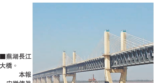
■蕪湖長江大橋。本報安徽傳真

香港文匯報訊(記者張長城 合肥報道)安徽省江北中區是皖江地區承接產業轉移的橋頭堡，也是蕪湖市跨江發展的重要平台。江北中區目前已累計完成固定資產投資99.1億元(人民幣，下同)，其中基礎設施類43.4億元、產業項目類55.7億元，預計明年投資將達到170億元，主要涉及基礎設施、工業及服務業。江北中區將加快項目建設，提升配套能力和產業規模，打造安徽的高端產業聚集區、蕪湖的生態濱江新城區。今年首三季，江北中區累計完成固定資產投資63.2億元，