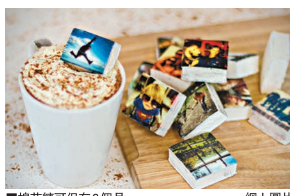
棉花糖可保存6個月。

顧客只需將Instagram帳戶與Boomf網站連結，再從相簿中挑選9張心水照片，就可列印成9粒長闊各4厘米的棉花糖，並寄到府上。Boomf提醒，印製棉花糖的解像度始終有限，建議用家選色彩對比