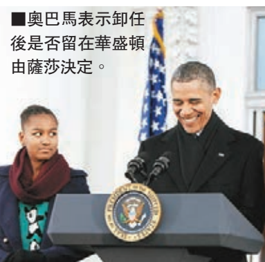
■奧巴馬表示卸任後是否留在華盛頓由薩莎決定。

美國總統奧巴馬夫婦接受美國廣播公司(ABC)年終專訪，奧巴馬表示，卸任後是否會留在華盛頓，主要看小女兒薩莎怎麼選，最重要是確保她能順利完成高中畢業，進入大學。他又認為美國擁有出色的女公僕，毫無疑問很快會誕生一位出色的女總統。