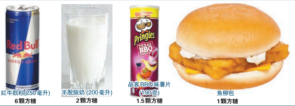
紅牛飲料(250毫升) 6顆方糖 半脫脂奶(200毫升) 2顆方糖 品客BBQ味薯片(190克) 1.5顆方糖 魚柳包 1顆方糖

爆谷和可樂是戲院睇戲「兩大寶」，但你知不知喝完一杯戲院大可樂，等同吃掉44茶匙的糖？可口可樂歐洲總裁昆西日前受訪時坦言，很多人不知道可樂含糖量如此高，而且人體根本毋須攝取這麼多糖分。每名成年人每日應攝取不多於50克(約10顆方糖)添加糖，但一瓶500毫升可樂含糖量已相當於10.5顆方糖，明顯超標。