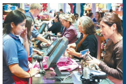
■不少商戶延長營業吸客。

美國「黑色星期五」促銷日剛完結，各大零售商開始盤點戰情。今年很多零售商選擇在感恩節當天開門，但延長營業時間似乎對刺激銷量沒有太大幫助，不少商戶客流明顯減少。造成這現象的原因之一，可能是網上購物愈趨普遍，分析更認為「黑色星期五」真正戰場已經轉移到網上。