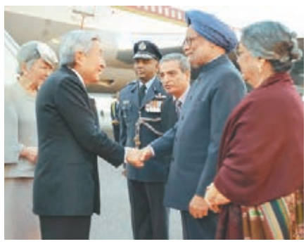
■明仁伉儷到訪，辛格夫婦(右)接機。

日皇明仁伉儷昨晚抵達印度展開6天訪問，印度以最高規格接待，總理辛格夫婦親赴新德里巴拉姆空軍基地接機；日皇夫婦所有正式行程，印度外長胡爾希德將全程陪同。分析認為，日皇到訪將深化兩國戰略夥伴關係。