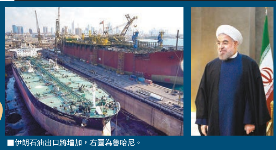
■伊朗石油出口將增加，右圖為魯哈尼。