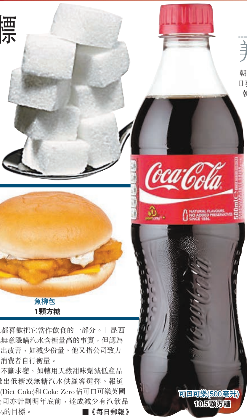
可口可樂(500毫升) 10.5顆方糖