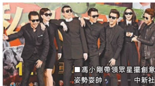
■馮小剛帶領眾星擺創意姿勢耍帥。

為使該片在文化特色和藝術呈現上更具敦煌本土味道，該片邀請西部文學《敦煌頌》作者、地道的敦煌人賀文龍加盟，擔任責任編劇，賀文龍說：「中國喜劇電影具有深厚的歷史背景和文化傳承，如今的很多作品在營造出一種輕鬆、幽默的氛圍同時，呈現出許多觀察社會、人生的全新角度。近年，旅遊題材的喜劇電影越來越受青睞，相信該片將會為影迷帶來古絲綢之路上的別樣感受。」