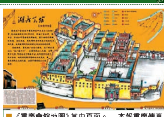
《重慶會館地圖》其中頁面。

香港文匯報訊(記者 袁巧 重慶報導)清初開始的「湖廣填四川」持續兩百多年，移民以原籍為單位建立起各種會館。重慶市地理圖書出版社近日推出《重慶會館地圖》，其中有重慶現存完好的67座會館，涉及省份達10餘個，尤以湖廣籍會館最多。重慶現存最早的會館是位於巴南區木洞鎮中壩村的萬壽宮，它是國內城市中心保存最大的會館之一。