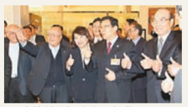
陳德銘(右二)直豎拇指。

香港文匯報訊 據中央社報導，海協會會長陳德銘8天7夜經貿之旅踏入第4天，陳昨日在台灣嘉義市用餐，品嚐嘉義市有名的雞肉飯，離去前向媒體表示「嘉義雞肉飯，好吃」。陳德銘上午在阿里山享受森林浴，由於安排的遊憩時間只有1小時，讓他感到意猶未盡，表示下次要自己來遊遍整個阿里山。