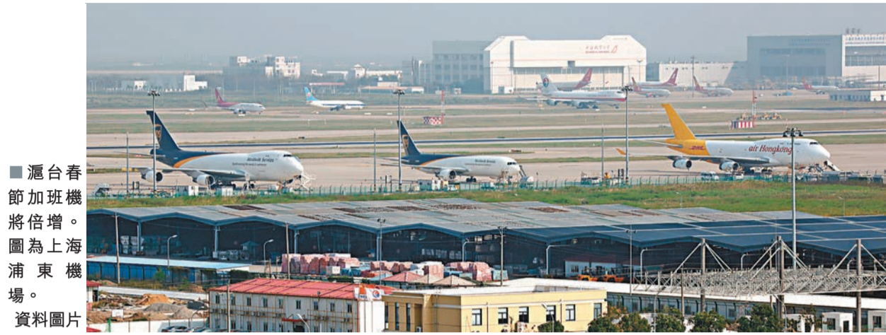
滬台春節加班機將倍增。圖為上海浦東機場。

香港文匯報訊 據中央社報導，備受關注的兩岸春節加班機完成協商，加班機期間為1月17日至2月14日，考量民眾及航空公司需求，航班總量不予限制，只在部分繁忙機場設上限，而運量需求最大的上海浦東機場班次往返上限由今年的50班大增至105，增幅超過一倍，雙方合共210班。