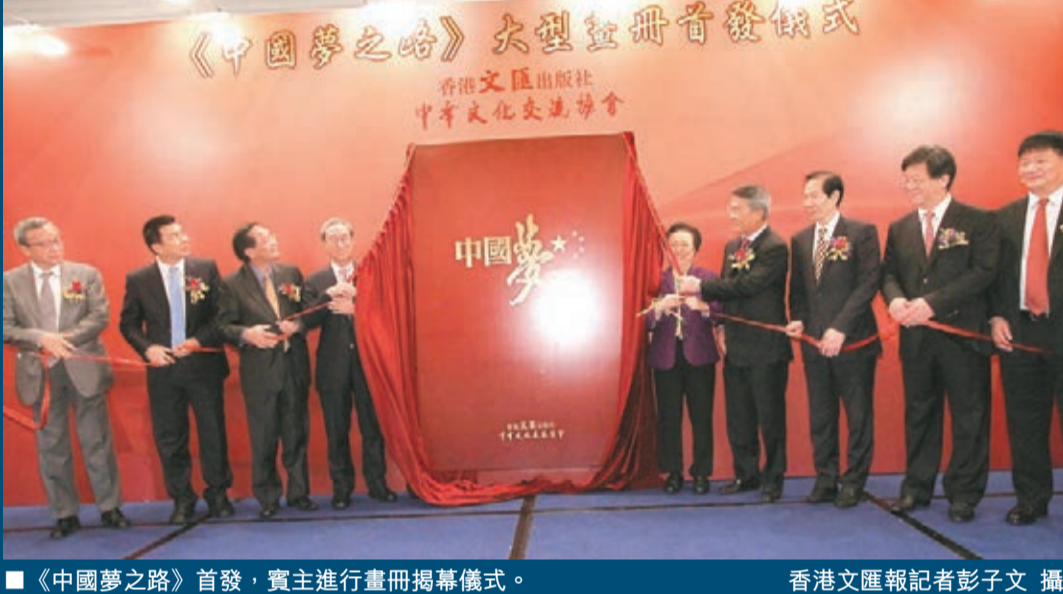
■《中國夢之路》首發，賓主進行畫冊揭幕儀式。