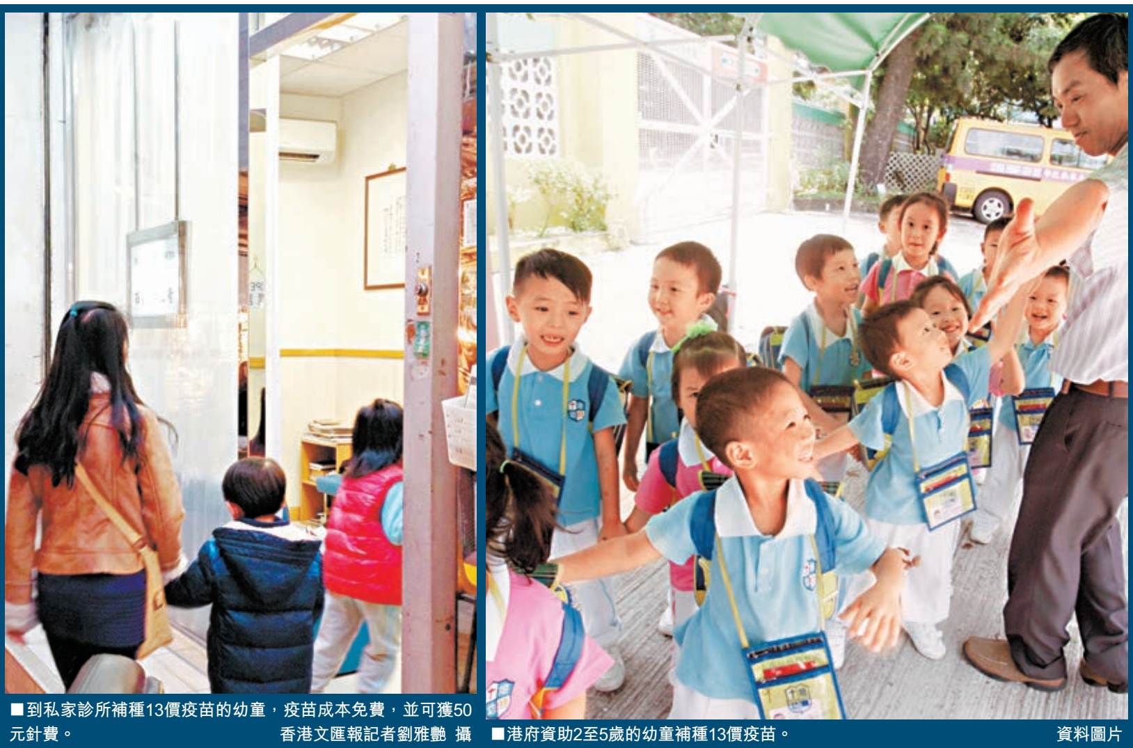
■到私家診所補種13價疫苗的幼童，疫苗成本免費，並可獲50元針費。

梁挺雄強調，現時有數萬劑疫苗存貨，並已安排藥廠在12月運送逾10萬劑疫苗來港，數量足以應付需求。他多次重申，本港現時並無爆發侵入性肺炎鏈球菌，呼籲家長不需要急於帶小朋友補打疫苗，亦無必要向多間私家診所預約疫苗，以免造成浪費，「所有疫苗的保護力並非百分之百，最重要是注意個人衛生」。