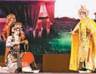
■《八千里路雲和月》在演藝學院公演。

其實亦正如丘亞葵今次邀請了香山粵劇的一批年青演員來港參與武打場面的演出，同樣希望帶給觀眾有新感覺。而今次演出很着重團體性，在正式演出前一晚，突然發現演藝舞台地毯如演員要做翻筋斗動作似乎存在危險，丘亞葵就即時要工作人員更換，對於眾演員的安全都沒有輕看。