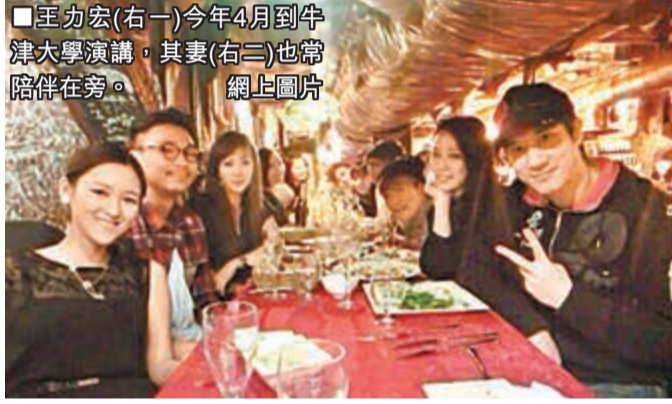
■王力宏(右一)今年4月到牛津大學演講，其妻(右三)也常陪伴在旁。

現年37歲的王力宏前日宣布已有一個可以牽手共度未來的女孩子，比他小10歲的哥倫比亞大學博士生李靚蕾，一日內旋即得到逾40萬網民及歌迷在微的留言祝福。收到多人的支持，Leehom昨日凌晨特發微博感謝大家：「感恩節快樂。感恩大家的祝福。」