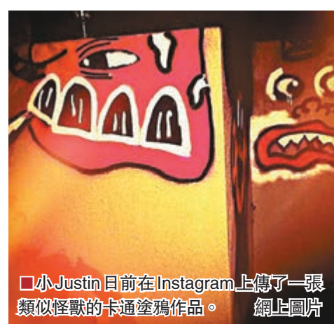
■小Justin日前在Instagram上傳了一張類似怪獸的卡通塗鴉作品。

另外，單是清潔似乎未能平息市長的憤怒，他向澳洲傳媒表示如果是普通人這樣做，他提議小Justin除了回到酒店清潔外，亦可以選擇下月回來開唱聖誕歌作補償。