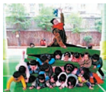
從照片可見由墊子隔開，上下三排孩子，最上面還壓着女老師。

該園薛姓負責人表示，這是中班的一項培訓課程，名叫「漢堡包」，源自國培遠程培訓課程健康領域資源，在上海等地都很普遍。他指針對中班幼兒的特點和