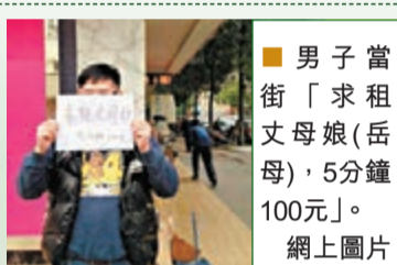
男子當街「求租丈母娘(岳母)」，5分鐘100元。

長沙馬王堆陶瓷新城，一男子當街「求租丈母娘(岳母)」，5分鐘100元，現場近百人圍觀，議論紛紛。該男子來自岳陽，剛在長沙買房，求租丈母娘是為了博得一個打折的機會。附近某婚房陶瓷品牌店新推出一款促銷活動，就是帶丈母娘來現場砸金蛋，一錘子最高能省1萬元，但男子的丈母娘在東北，所以他靈機一動，決定花100元臨時租個丈母娘。店舖負責人楊先生表示，丈母娘和女婿的關係，確實不好鑒定，他們原則上都認可。