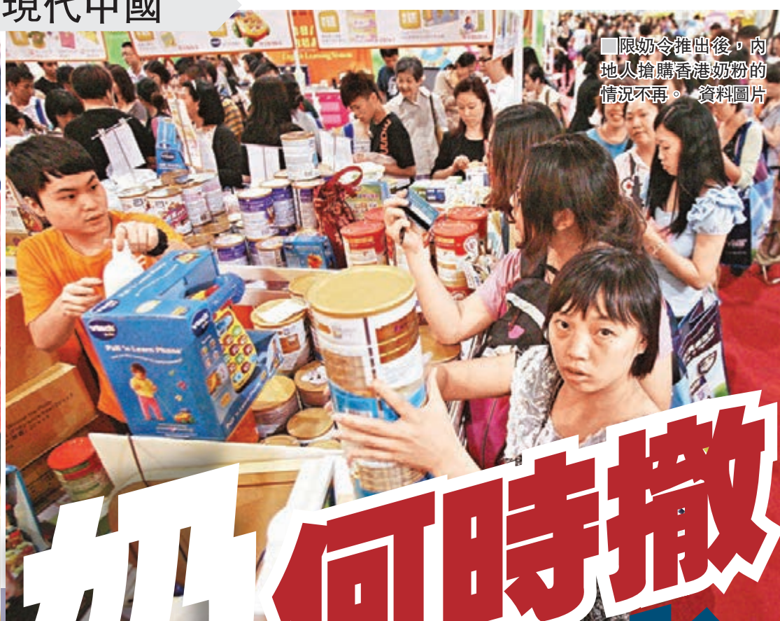
■限奶令推出後，內地人搶購香港奶粉的情況不再。資料圖片