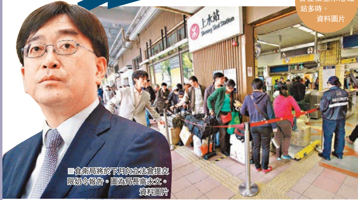
■食衛局將於下月向立法會提交限奶令報告。圖為局長高永文。