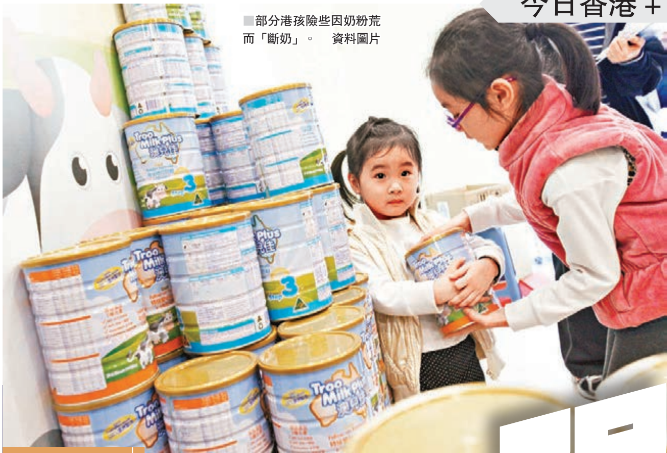
■部分港孩險些因奶粉荒而「斷奶」。資料圖片