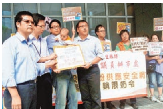
■有本地團體反對撤銷限奶令。資料圖片

商機，在全港各地搶購奶粉。影響所及，香港個別品牌的奶粉未能滿足本地需要，出現「奶粉荒」。故有意見認為，奶粉供應緊張是民生問題，雖然限奶令未必是最佳做法，但的確有助穩定本地奶粉供應。