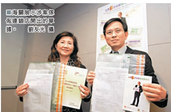
海關展示涉案傢俬連鎖店開出的單據。