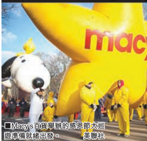
■Macy's百貨舉辦的感恩節大巡遊準備就緒出發。