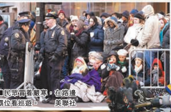
■民眾冒着嚴寒，在路邊霸位看巡遊。