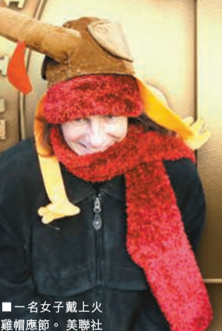
■一名女子戴上火雞帽應節。